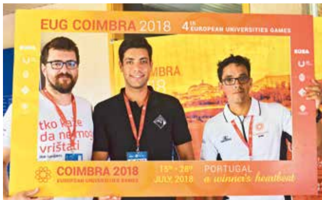
Nakon uspješno organiziranih Europskih sveučilišnih igara u Zagrebu i Rijeci, sljedeće okupljanje najavljeno je u Coimbri

na gradskog sveca zaštitnika, očekuje 17. izdanje međunarodne veslačke regate Sveti Duje . Kako je već uobičajeno, uz slavne posade Oxforda i Cambridgea na spinutskom pontonu i tamošnjem akvatoriju vesla "ukrstit" će još brojna druga sveučilišta iz cijele Europe. Tradiciju bi trebale održati i posade legendi Oxforda, Cambridgea i Splita koje će se ogledati na "sprinterskoj" regati u splitskoj gradskoj luci.