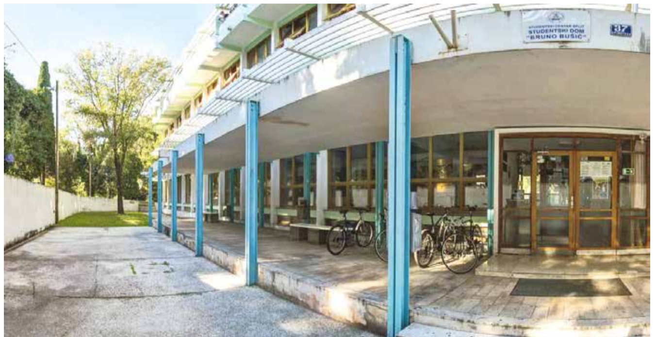
Sadašnji izgled Studentskog doma 'Bruno Bušić'

Ukupna vrijednost projekta je točno 61.643.911 kuna, a uz spomenuta bespovratna sredstva Sveučilište u Splitu je obvezno osigurati 28.230.952 kune za financiranje, uz potporu Fonda za zaštitu okoliša i energetske učinkovitost, Ministarstva znanosti i obrazovanja i vlastita sredstva partnera projekta Studentskog centra Splita.