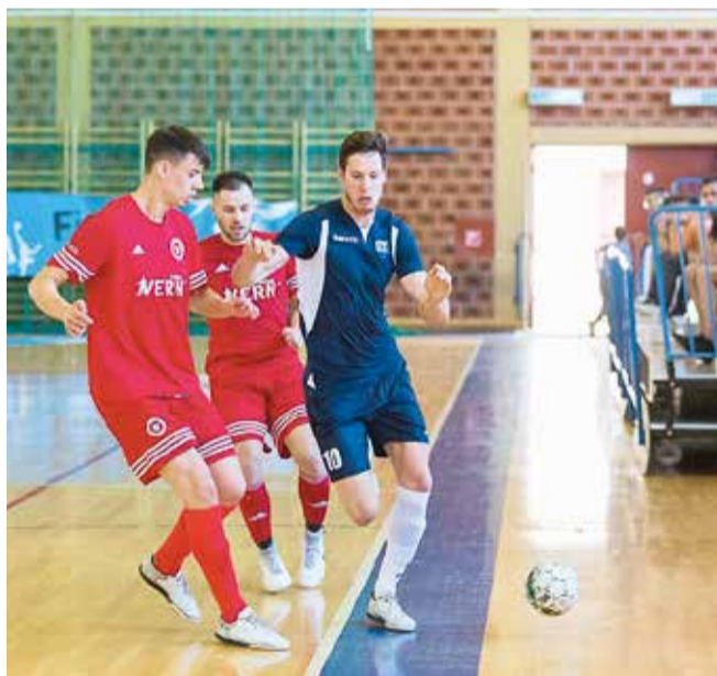
Kreće i završnica sveučilišnog prvenstva u futsalu

Ove godine će se prvi put održati Unisport Play , natjecanje koje uključuje pet sportova, no vrhunac godine svakako su 4. po redu Europske sveučilišne igre u portugalskoj Coimbri, jednom od najstarijih svjetskih sveučilišta