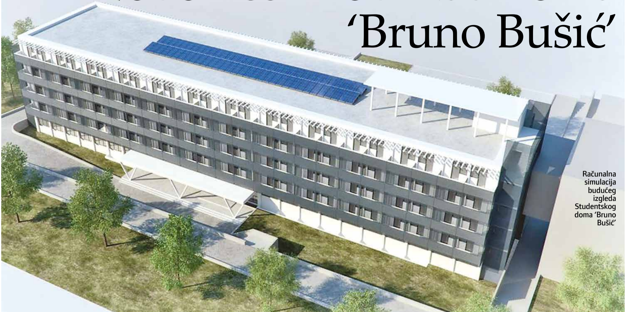
Računalna simulacija budućeg izgleda Studentskog doma 'Bruno Bušić'

Dugoočekivana rekonstrukcija Studentskog doma 'Bruno Bušić' dobila je značajnu financijsku 'injekciju' iz europskih fondova, kojima će biti pokriveno više od polovice ukupne investicije