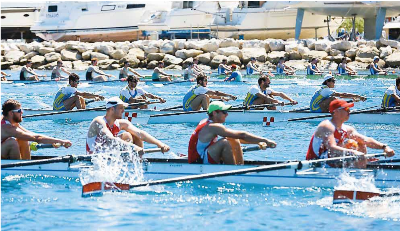
Veslači će u Splitu održati tradiciju na blagdan svetog Dujma

HRVATSKA SVEUČILIŠTA ČEKA BOGATO SPORTSKO PROLJEĆE I LJETO