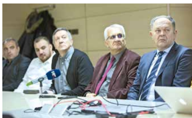
Predstavljanje projekta rekonstrukcije Studentskog doma 'Bruno Bušić'