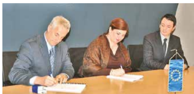
Potpisivanje ugovora o financiranju rekonstrukcije Doma