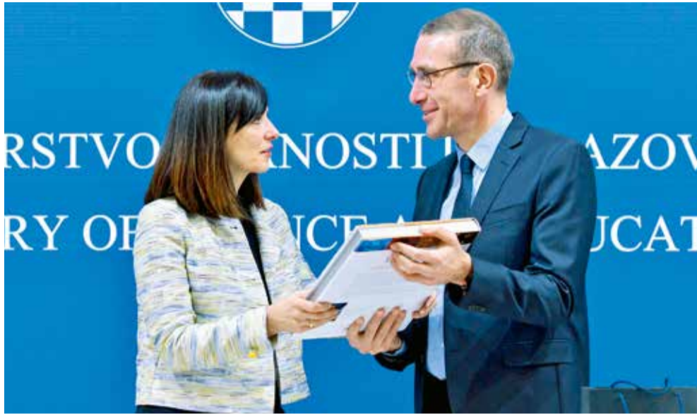
Ministrica Blaženka Divjak i Frederic Nordlund razmjenjuju potpisani sporazum

Hrvatska je posljednja članica EU-a koja će ovim sporazumom biti uključena u programe ESA-e, a od koje će koristiti imati brojne znanstvene institucije, znanstvenici, ali i tvrtke