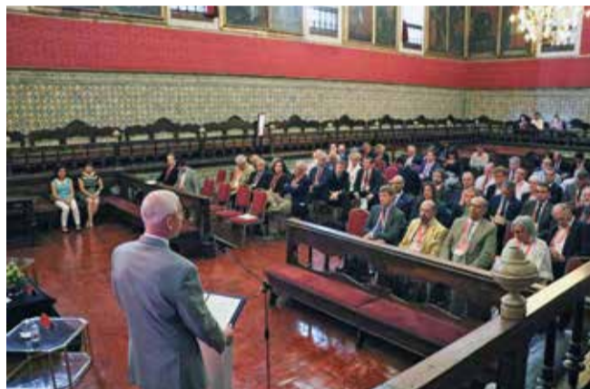
Tijekom igara održana je i rektorska konferencija