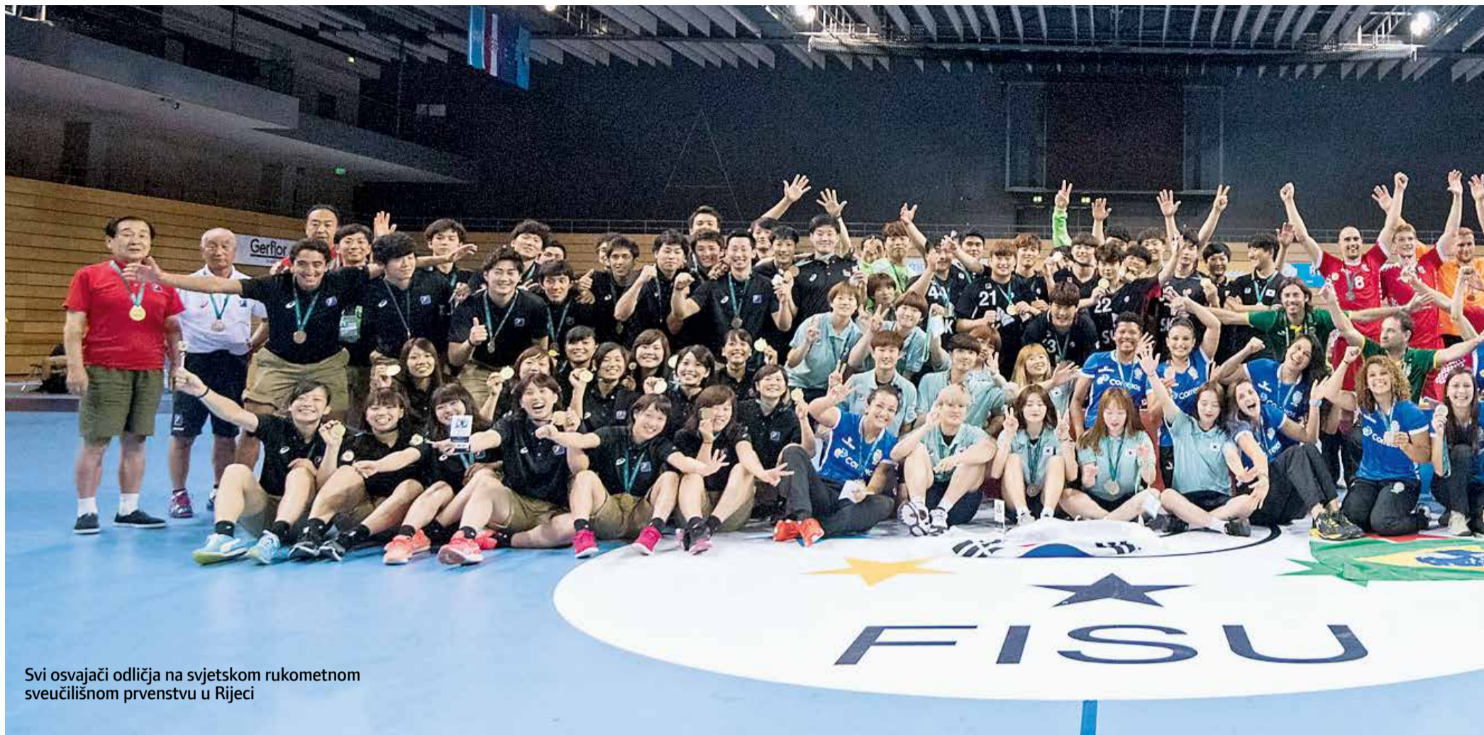
Svi osvajači odličja na svjetskom rukometnom sveučilišnom prvenstvu u Rijeci

RIJEKA UGOSTILA RUKOMETNI SVEUČILIŠNI MUNDIJAL