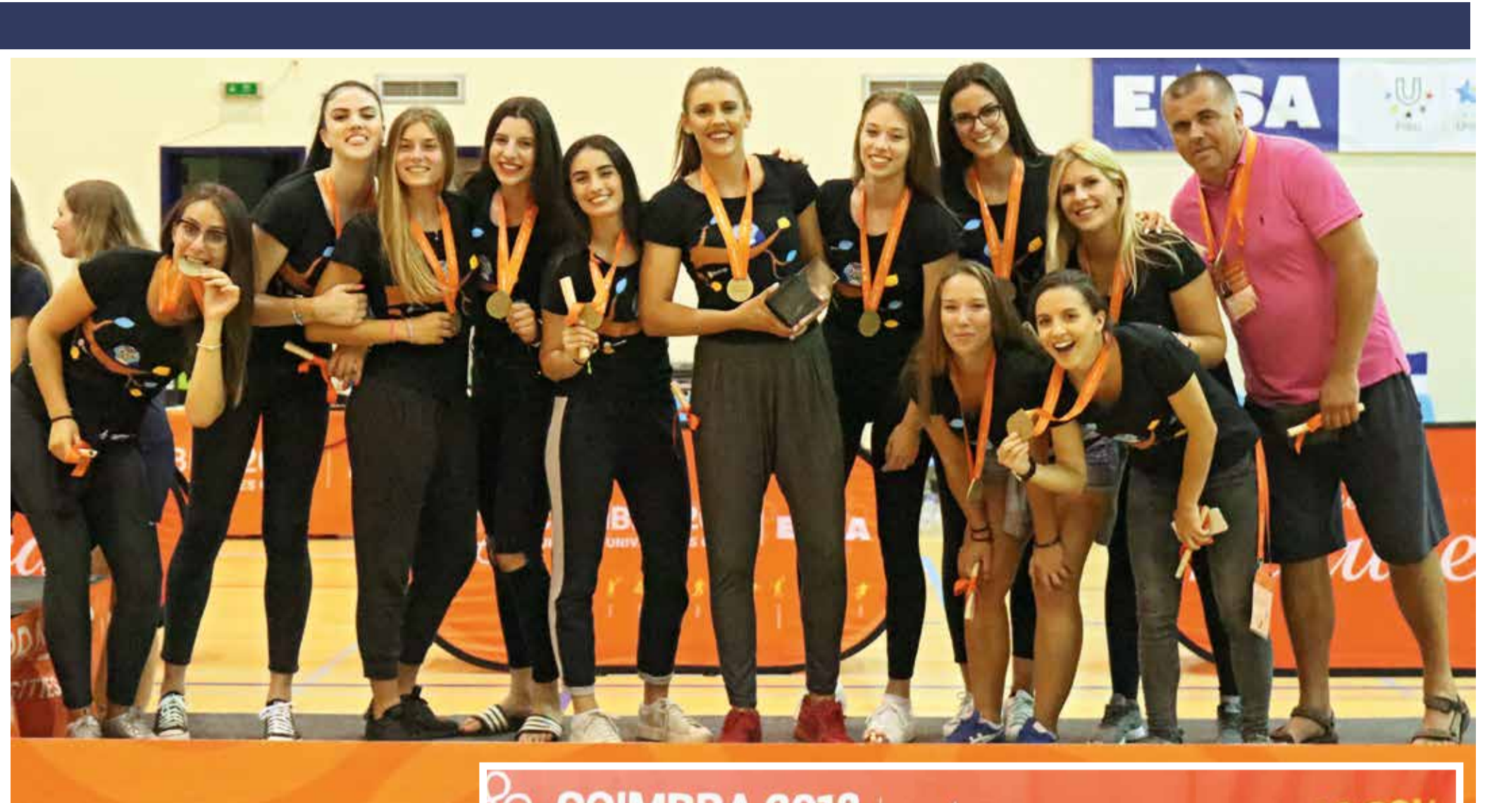
Brončane odbojkašice Sveučilišta u Rijeci