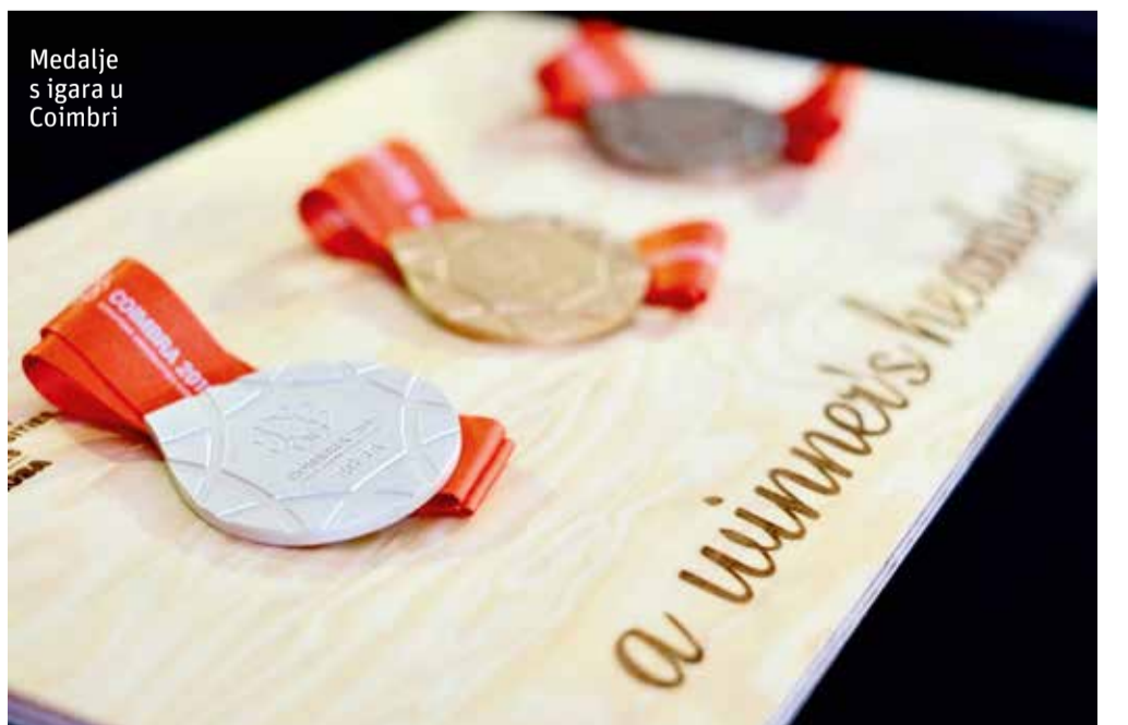
Medalje s igara u Coimbri