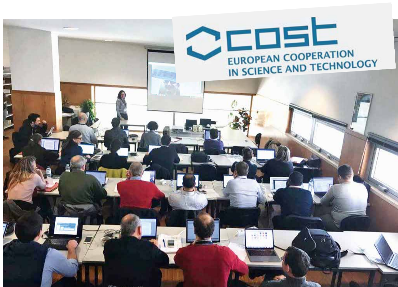
Sastanak UO COST akcije CA15127RECODIS