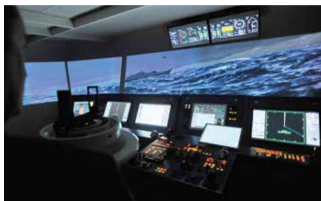
Simulator splitskog Pomorskog fakulteta na kojem će se obrazovati i budući vojni pomorci NIKOLA VILIĆ/HANZA MEDIA

Kako se već i najavljivalo, u suradnji Sveučilišta u Splitu i HVU-a 'Dr. Franjo Tuđman' u rujnu kreće prva akademska godina studija Vojno pomorstvo, koji će s jedne strane biti prilagođen standardima NATO-a, a s druge će kadetima pružati sve kompetencije koje se i inače stječu na pomorskim fakultetima