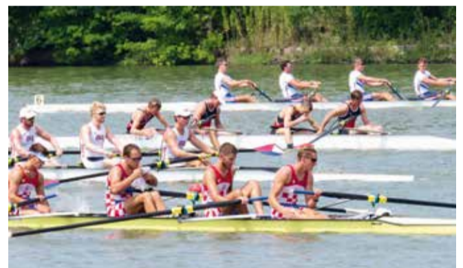
Završetak utrke četveraca na svjetskom sveučilišnom prvenstvu

Inače, na prvenstvu se najuspješnijom pokazala kolijevka natjecateljskog i sveučilišnog veslanja – Ujedinjeno