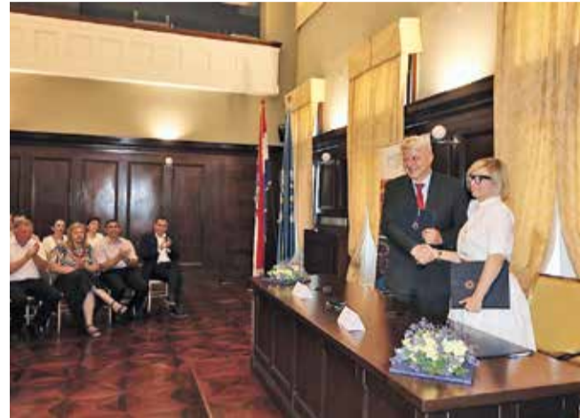
Zlatko Komadina, župan primorsko-goranski, i Snježana Prijic-Samaržija, rektorica riječkog sveučilišta, nakon potpisivanja sporazuma

Ova je institucijska suradnja preduvjet za uključivanje tijela javne vlasti, poduzetnika i drugih poslovnih subjekata kao neizostavnih dionica S3 europske strategije, u poticanju inovacija i regionalnog razvoja i prosperiteta zasnovanog na znanju, realnim resursima, kapacitetima i interesima. Svrha sporazuma zajedničko je poticanje integracije znanstveno-istraživačkih i poduzetničkih kapaciteta s ciljem optimalnijeg korištenja realnih razvojnih potencijala, jačanje znanstve-