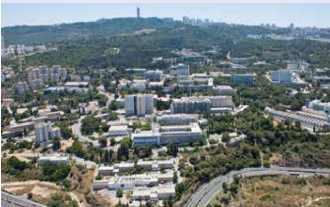
Kampus Techniona u Haifi

RANKING: ARWU World - 93.; Šangajska lista - 77.; Center for World University Rankings - 51.; Times Higher Education - 201-225.