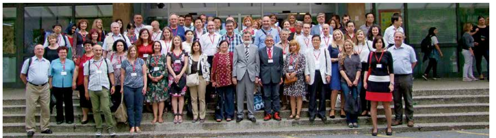
Skup matematičara na zagrebačkom FER-u