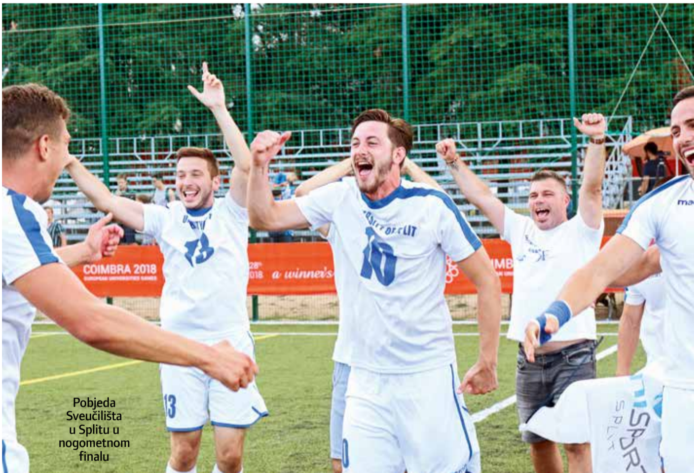
Pobjeda Sveučilišta u Splitu u nogometnom finalu