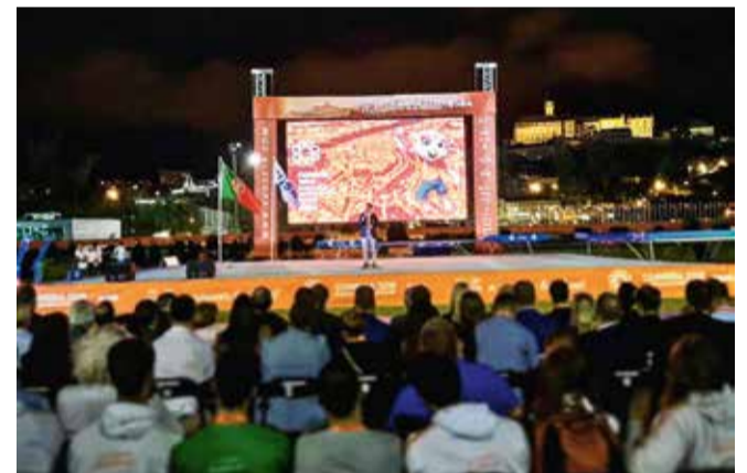
Prizor sa svečanog zatvaranja