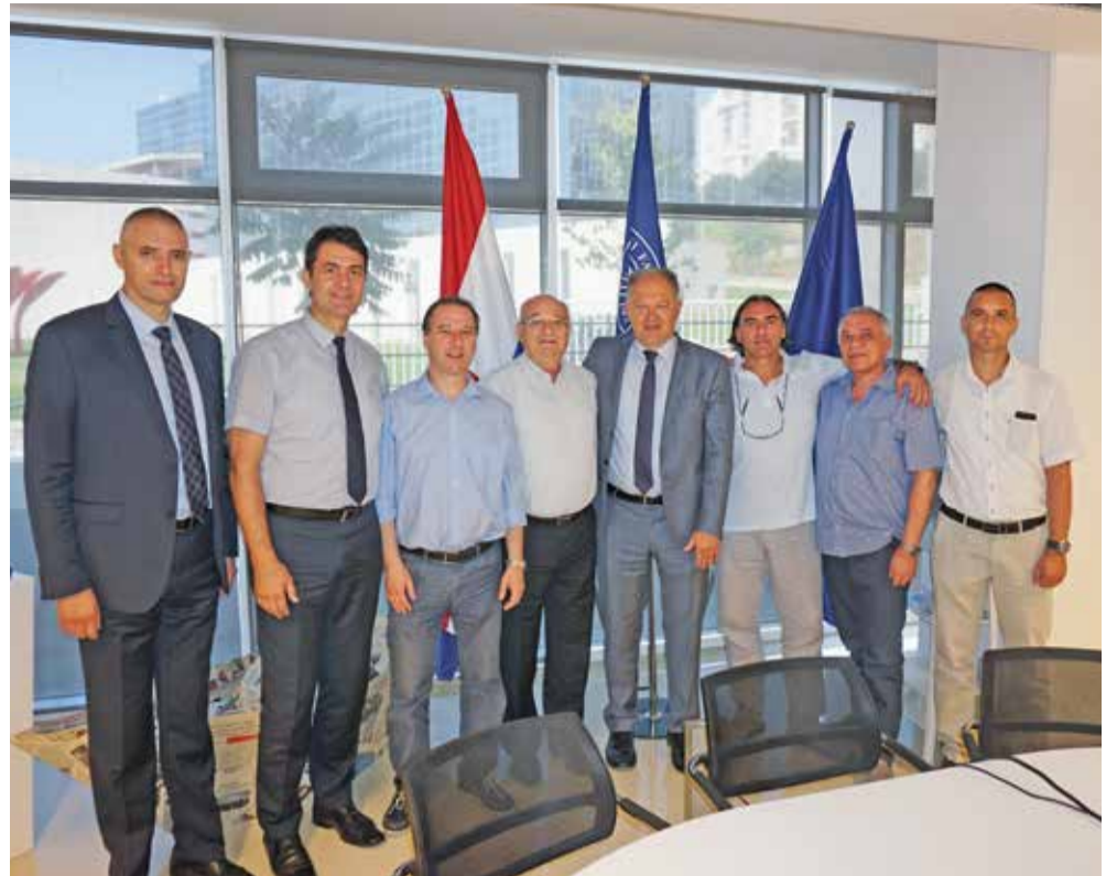
Predsjednik izraelskog Techniona Peretz Lavie u posjetu Splitu i Sveučilištu u Splitu