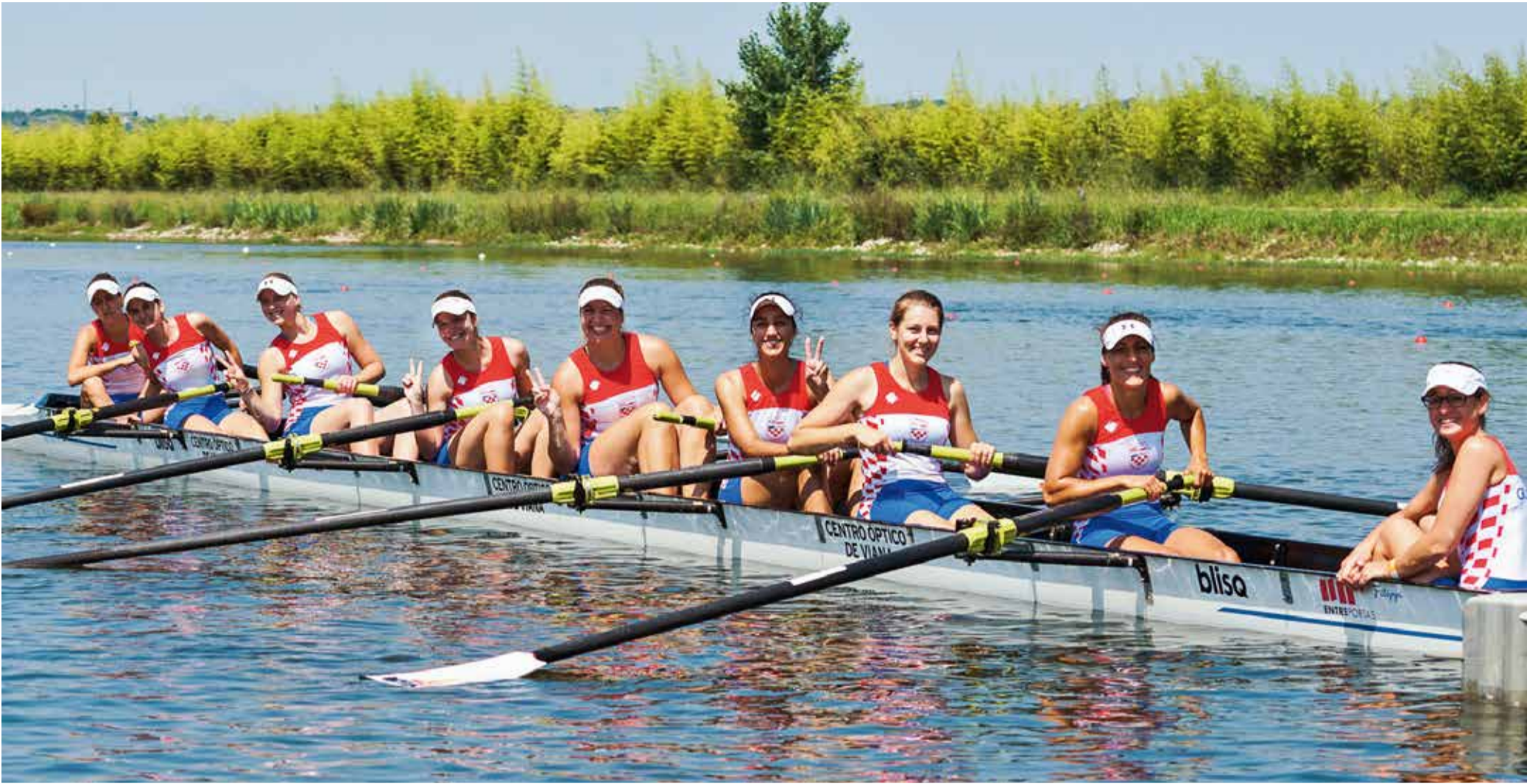
Brončani ženski osmerac Sveučilišta u Zagrebu