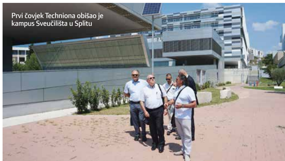
Prvi čovjek Techniona obišao je kampus Sveučilišta u Splitu