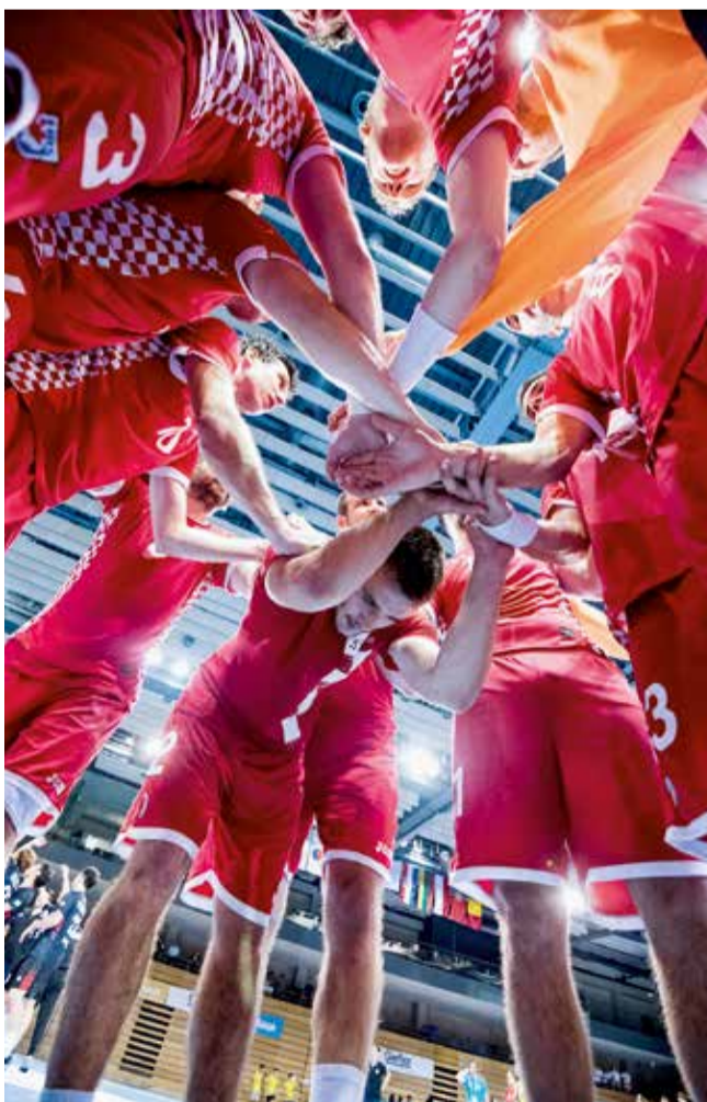
Zajedništvo hrvatskih reprezentativaca na svjetskom studentskom prvenstvu

Finale je bilo priča za sebe: s jedne strane vrhunski uigrana i motivirana ekipa Koreje, s druge momci iz Hrvatske koji su postigli uspjeh života i izgarali su za još većim. Iako dominacija Korejaca kreće od prvih sekundi utakmice, naši su se hrabro borili, stalno nadoknađivali razliku te držali zaostatak na manje od dva gola razlike. Pred sam kraj utakmice ostvarili su odličnu seriju koja ih dovodi na