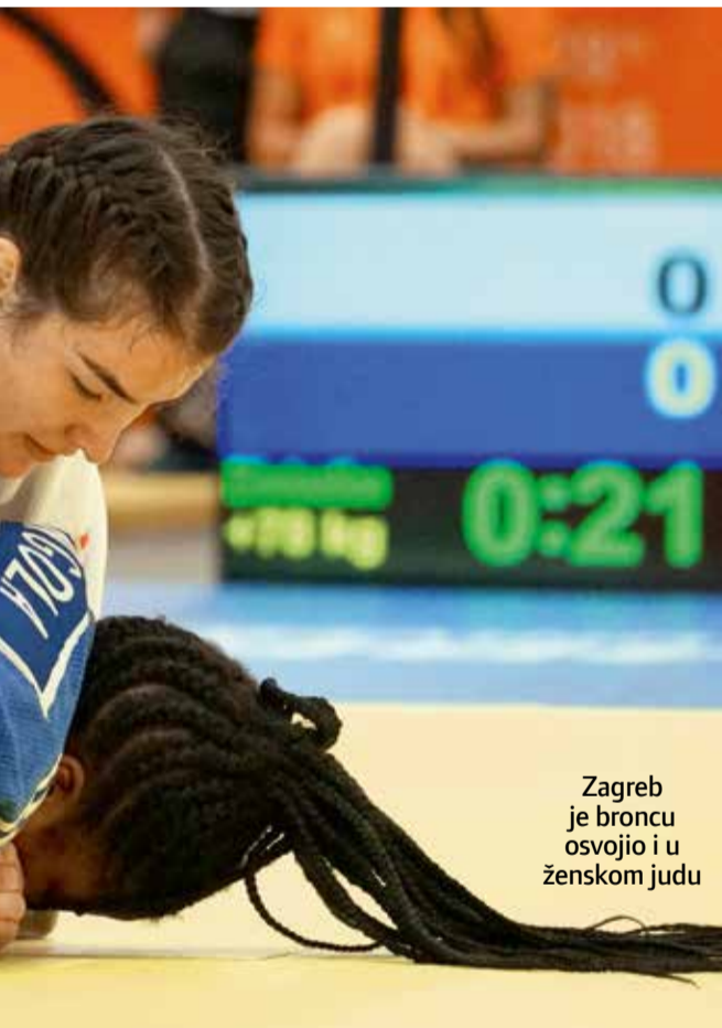
Zagreb je broncu osvojio i u ženskom judu