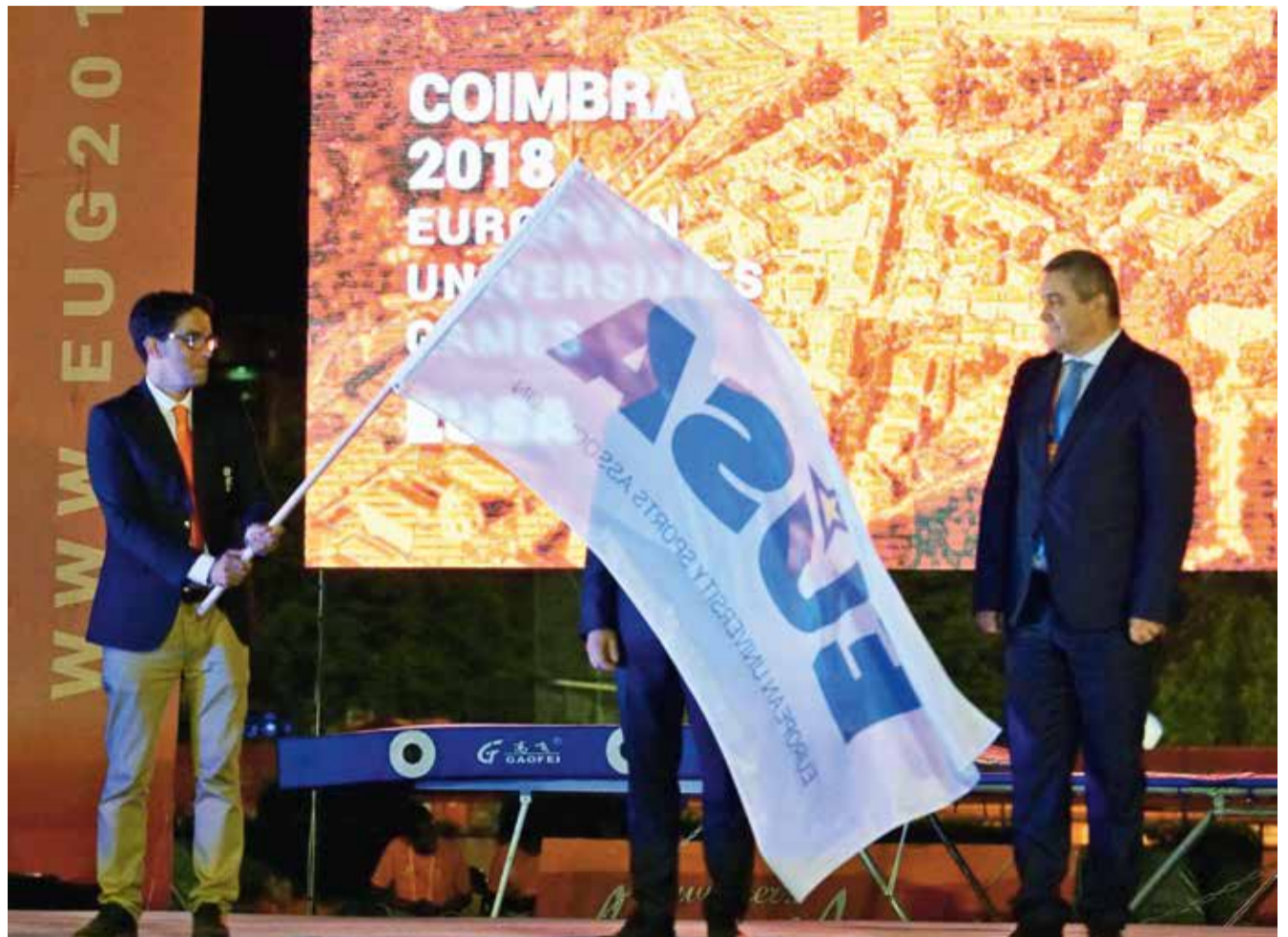
Predaja zastave EUSA sljedećem domaćinu, Univerzitetu u Beogradu

Podsjetimo, treće izdanje Europskih sveučilišnih igara održano je u Zagrebu i Rijeci 2016., a na ceremoniji zatvaranja ovoga izdanja zastavu su preuzeli domaćini 2020. godine – Beograd.