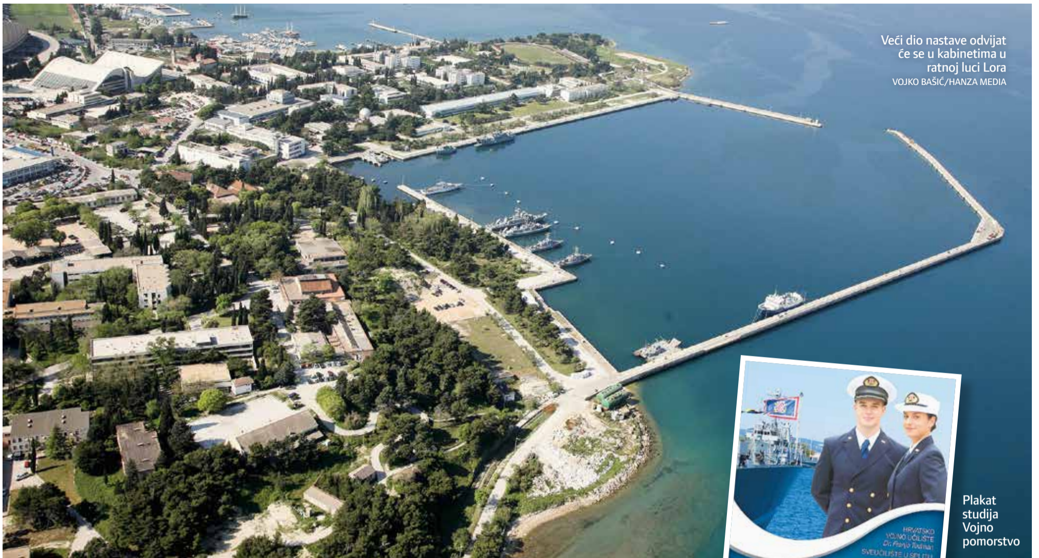
Veći dio nastave odvijat će se u kabinetima u ratnoj luci Lora