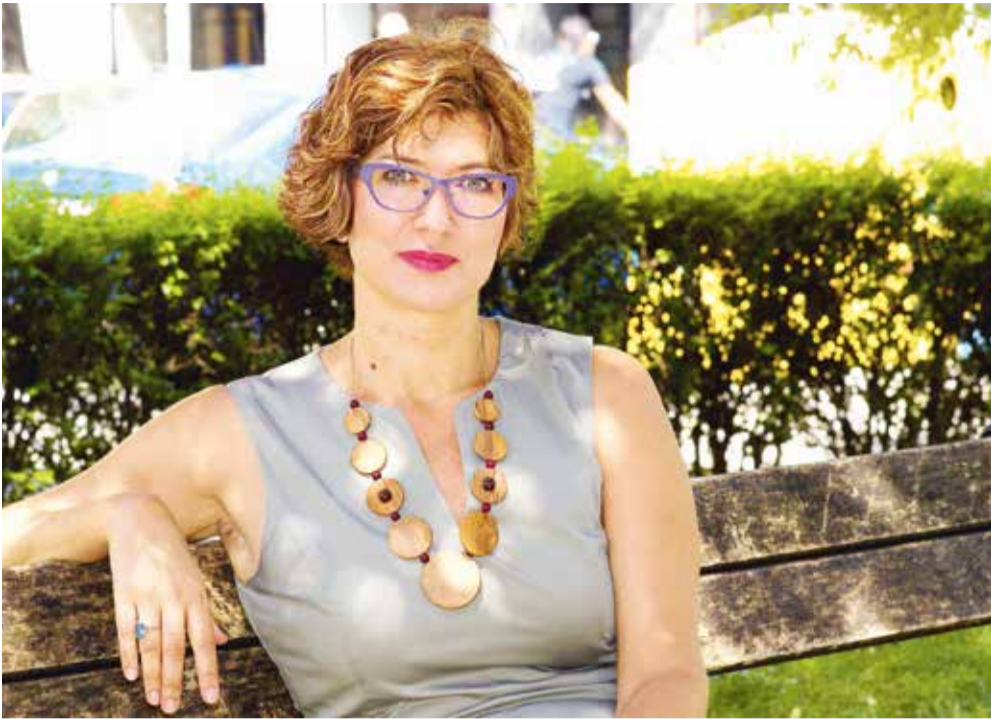
“Predsjednica Kolinda Grabar Kitarović je na svjetskom prvenstvu kombinirala cijeli niz elemenata koji pripadaju sferi celebrity politike”

toj celebrity diplomaciji da je postao stručan za pitanje koje zagovara. Tu su još Angelina Jolie, Matt Damon, George Clooney, Susan Sarandon... Najčešće je riječ o raznim humanitarnim ciljevima, obično međunarodnim, zato ne možemo povući direktnu paralelu s našim glumcima i pjevačima, ali oni su ključna poluga u domaćim humanitarnim akcijama. Događaji u kojima oni sudjeluju dobivaju na važnosti i na vidljivosti. Pogotovo u svijetu digitalnih medija koji sami po sebi potenciraju dojam intimnosti.