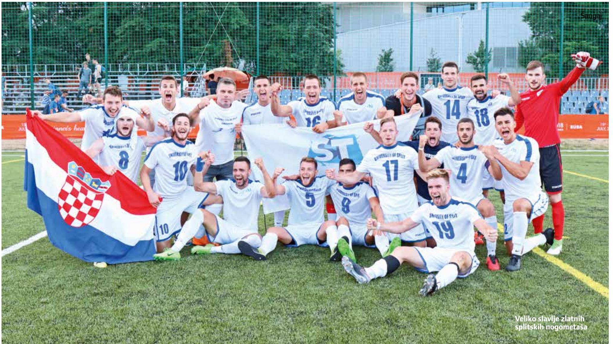
Veliko slavlje zlatnih splitskih nogometaša