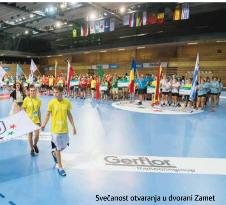
Svečanost otvaranja u dvorani Zamet