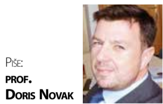
PIŠE: PROF. DORIS NOVAK

Cilj ujedinjene Europe je jedinstveno (europsko) nebo, pa se u okviru sustava upravljanja zračnim prometom aktualno provodi sveobuhvatan projekt pod nazivom SESAR, s ciljem podizanja razine sigurnosti, povećanja kapaciteta zračnog prostora, smanjenja troškova upravljanja zračnim prometom i smanjenja njegova negativna utjecaja na okoliš, a namjera je i da se uz postojeći volumen zračnog prostora, koji se ne može povećavati, značajno poveća kapacitet, odnosno broj zrakoplova koji će moći istovremeno letjeti