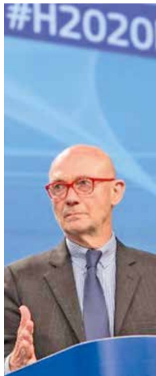
President Emeritus Pascal Lamy s Instituta Jacques Delors