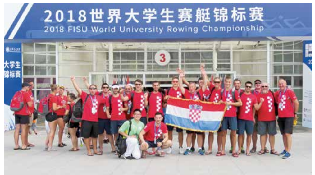
Hrvatski sudionici svjetskog sveučilišnog prvenstva u veslanju u Šangaju

Dobrim rezultatima naši studenti-veslači najavili Svjetsko prvenstvo koje će se 2020. godine održati u Zagrebu