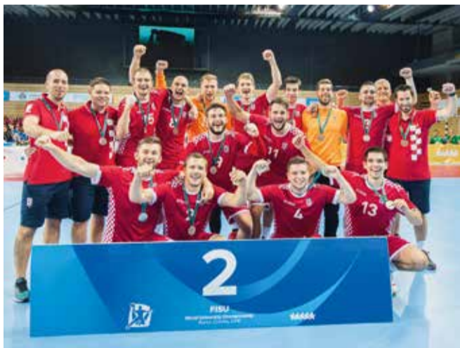
Srebrni hrvatski studenti rukometaši