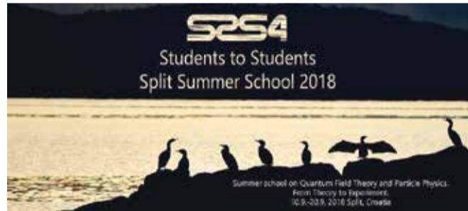
Ljetna škola splitskog PMF-a