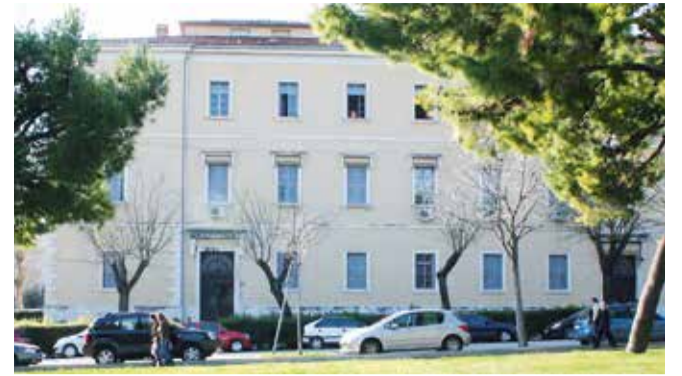
Katoličko-bogoslovni fakultet u Splitu

MEĐUNARODNI ISTRAŽIVAČKI SEMINAR U SPLITU BOGOSLOVNIH FAKULTETA U SPLITU I BOCHUMU