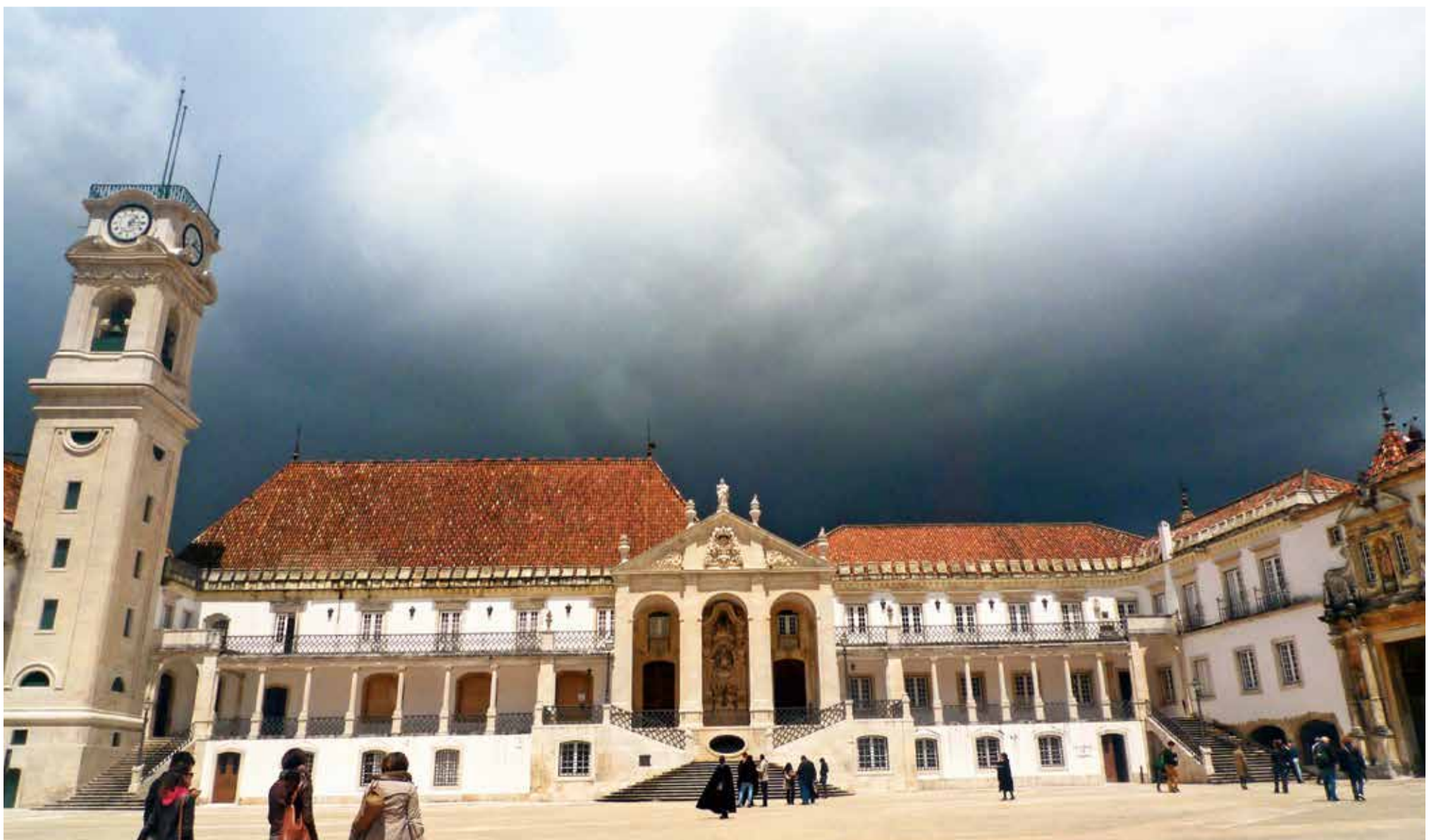
Sveučilište u Coimbri u Portugalu, jedno od najstarijih na svijetu