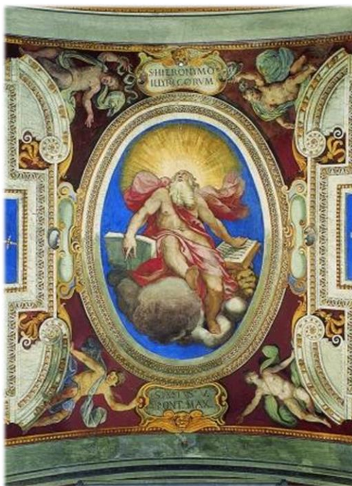
Paris Nogari: Apoteoza sv. Jeronima . Crkva Papinskoga hrvatskoga zavoda sv. Jeronima, Rim, 1589–1590.