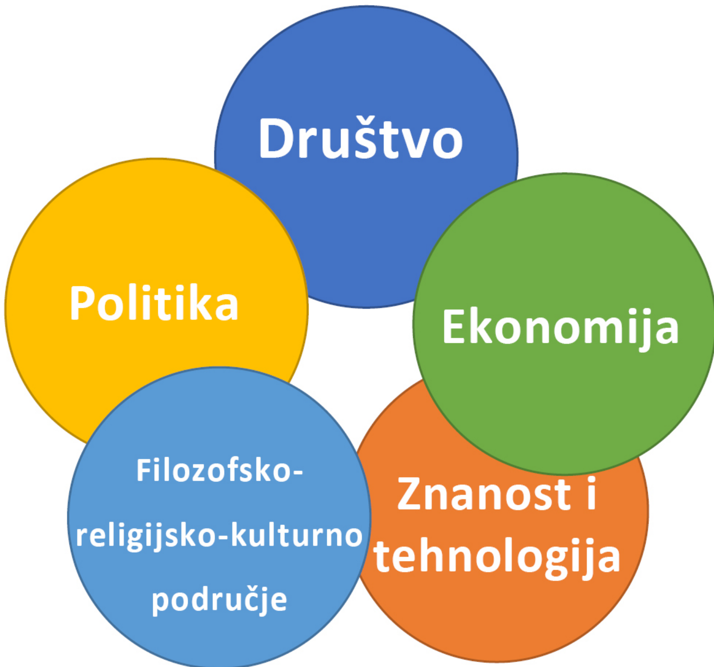
Slika 1. Domene u kurikulumu Povijesti