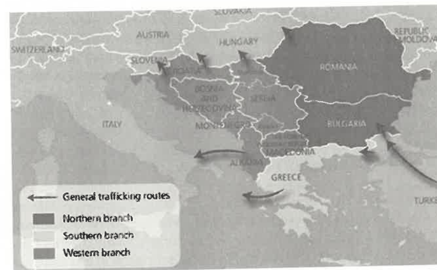
Slika 3. Glavne krijumčarske rute u jugoistočnoj Europi.

Geografski i geoprometni položaj u jednu ruku predstavlja komparativnu prednost, te može nadoknaditi nepovoljne okolnosti s kojima se Hrvatska danas susreće (nestabilnost dijela političkog okruženja, specifična i ograničena prirodna bogatstva), dok u drugu ruku predstavlja sigurnosni izazov, osobito zbog toga što se Hrvatska nalazi na tzv. balkanskoj ruti, jednoj od najvećih krijumčarskih ruta na svijetu.