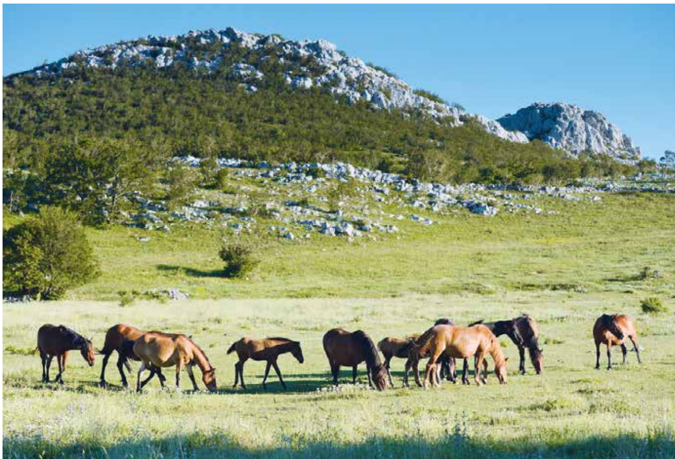
Bosanski konji naseljeni u Nacionalni park Paklenica

OXFORDSKI PROFESOR PAUL JEPSON NA ZAGREBAČKOM ŠUMARSKOM FAKULTETU