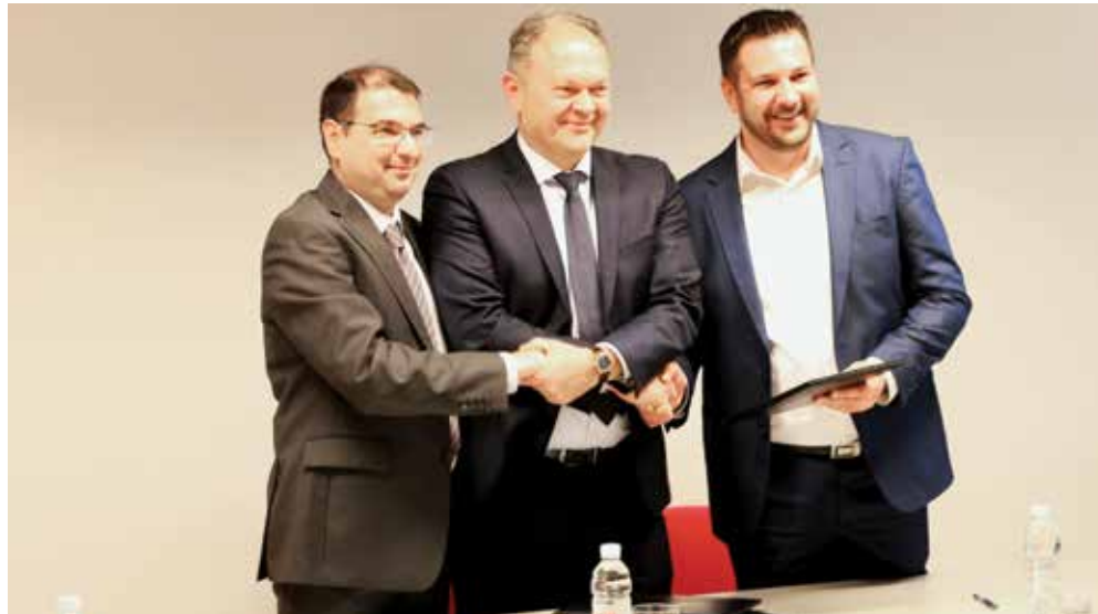
Sporazum Sveučilišta u Splitu, KTF-a i Kaštela

SPLIT: ZAVRŠILA 1. ZIMSKA ŠKOLA EUROPSKE UDRUGE STUDENATA PRAVA