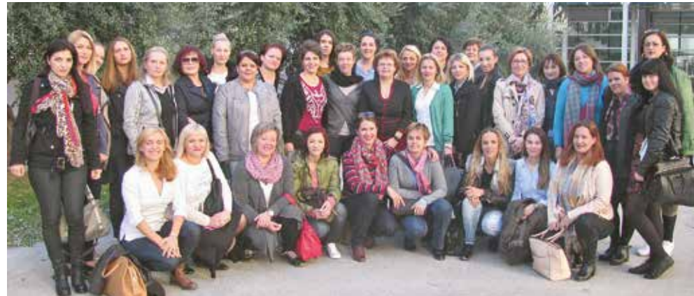
Sudionici tečaja o dojenju na splitskom Medicinskom fakultetu

Jubilarni, deseti tečaj I. kategorije za zdravstvene djelatnike o zaštiti, promicanju i podršci dojenju, održan je prošle jeseni, u listopadu i studenome, na Medicinskom fakultetu Sveučilišta u Splitu. Organizator i nositelj tečaja je Katedra za obiteljsku medicinu Medicinskog fakulteta. Prvi takav tečaj, kao jedini u Hrvatskoj, održan je na ovom fakultetu još 2007. godine. Obrazovno-odgojni sadržaj namijenjen je liječnicima (obiteljskim, pedijatrima, ginekolozima), primaljama i medicinskim sestrama svih stupnjeva, a osim sudionica i sudionika iz Hrvatske, na tečaju su prisutni i njihovi kolege iz Bosne i Hercegovine, Srbije i Makedonije. Pored domaćih predavača tu su i kolegice iz Slovenije (tamo je istovrsni tečaj pokrenut već ranije),