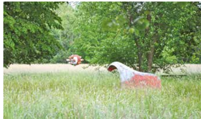
Park skulptura Željezare Sisak: radovi Peruška Bogdanića ‘Bez jahača’ (1983) i Josipa Zemana, iz ciklusa ‘Crne vizije I’, (1983)

Sveučilište u Splitu, Gradski muzej Sisak i Centar za istraživanje materijala METRIS partneri su na milijun eura vrijednom međunarodnom projektu posvećenom očuvanju umjetničkih djela u javnome prostoru koji se realizira u okviru Erasmus+ programa Knowledge Alliances, i u sklopu kojega će se hrvatski tim baviti Parkom skulptura Željezare Sisak