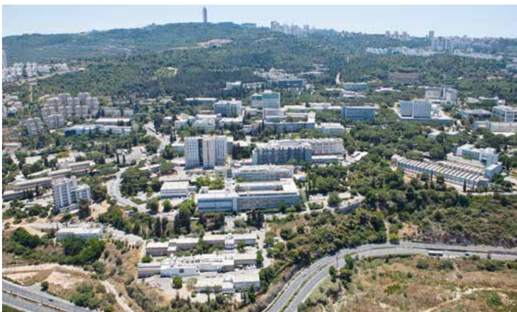
Kampus izraelskog sveučilišta i instituta Technion