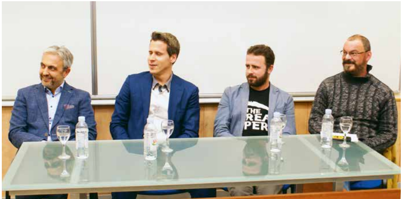
Menadžeri uspješnih prehrambenih tvrtki predstavili su se studentima PBF-a

STUDENTI PBF-a FINANCIJSKOM ANALIZOM UČILI O UPRAVLJANJU PREHRAMBENIM TVRTKAMA