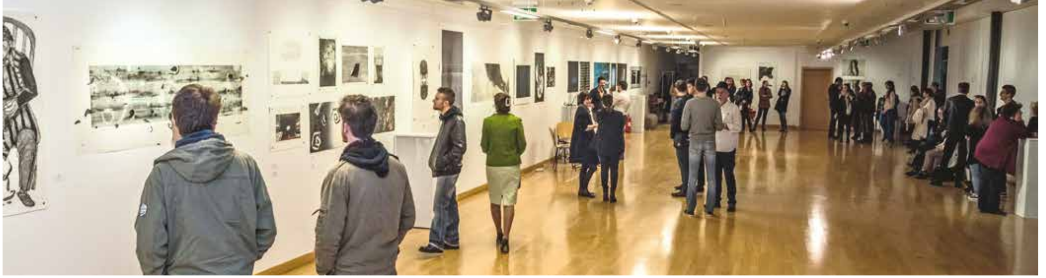
Studentska selekcija 8. Splitgraphica