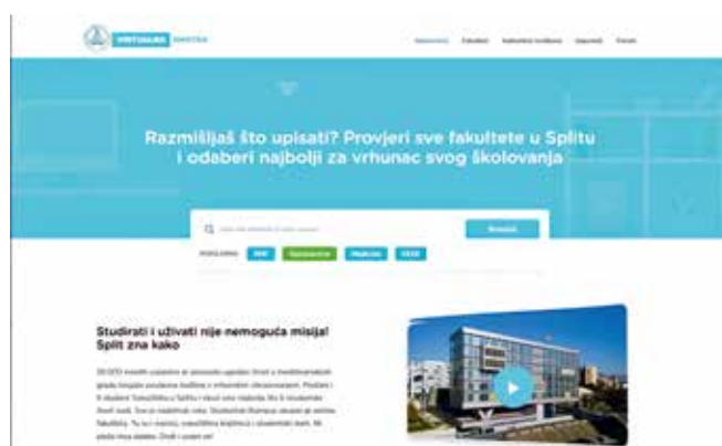
Virtualna smotra Sveučilišta u Splitu