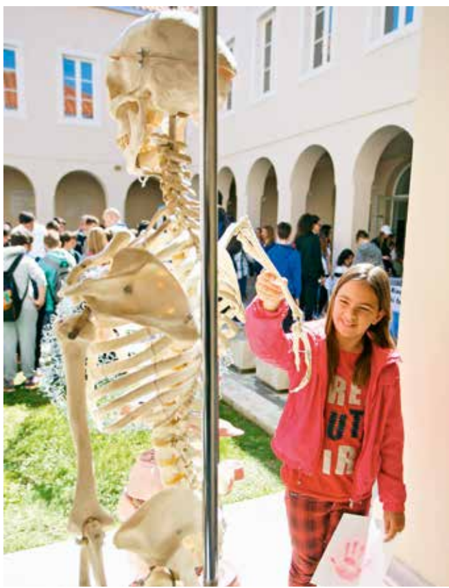
DIJE KLARIĆ/HANZA MEDIA