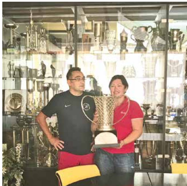
Suradnja splitske Kineziologije i sportskog sveučilišta u Kaunasu u Litvi