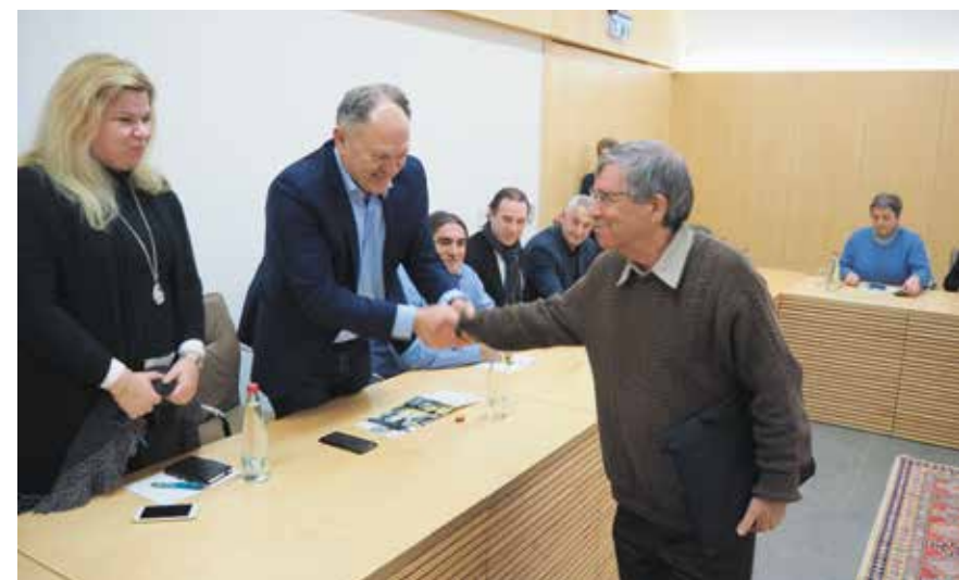
Čelnici splitskog Sveučilišta susreli su se s brojnim kolegama u Izraelu