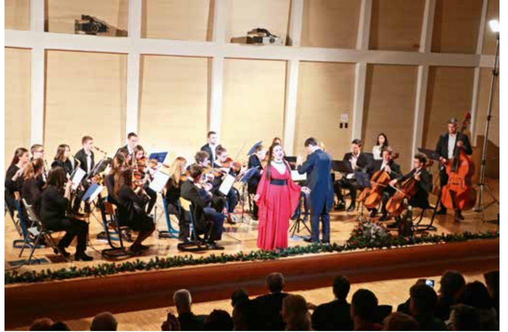
Humanitarni koncert Sveučilišta u Splitu

JOŠ JEDNA USPJEŠNA BLAGDANSKA HUMANITARNA AKCIJA SVEUČILIŠTA U SPLITU