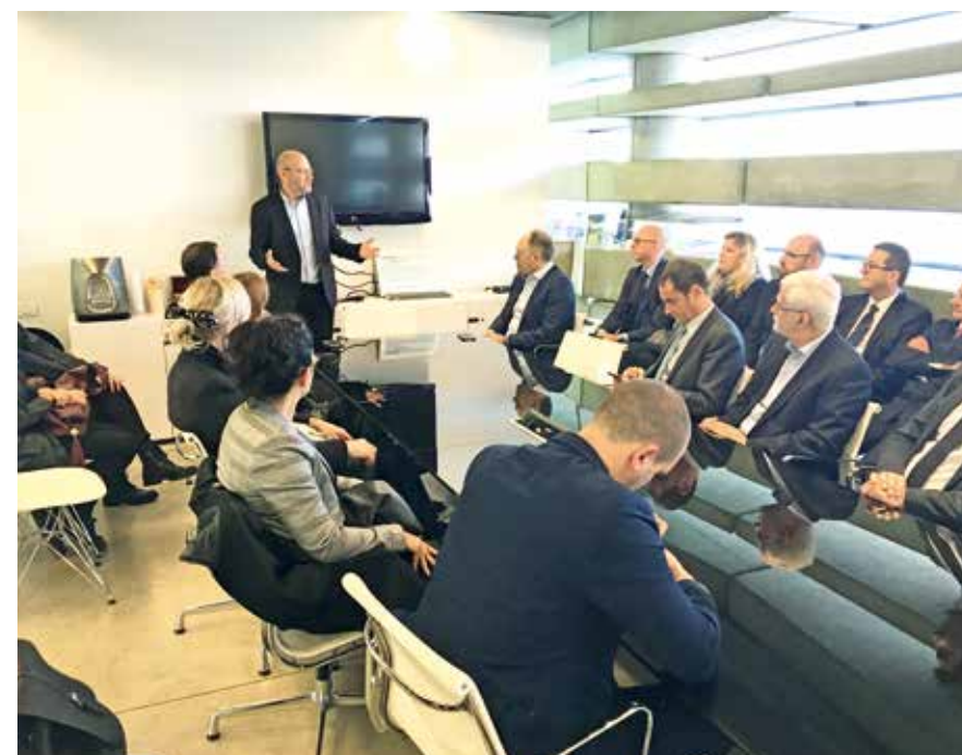
Jedno od brojnih predavanja za splitsko izaslanstvo u Izraelu