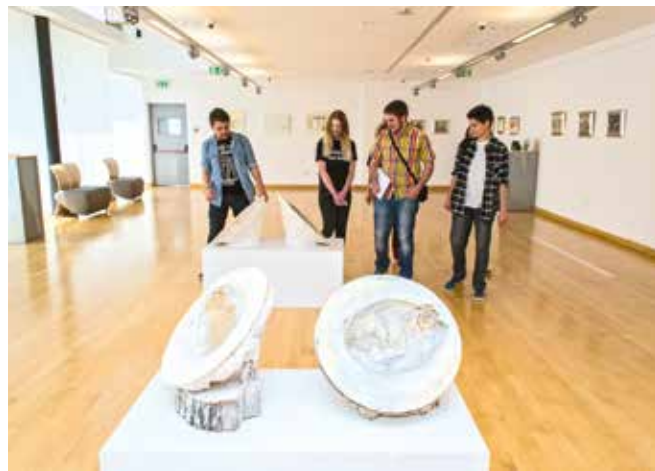
Skupna izložba 'Dah Mediterana'

Bogatim programom u 2017. godini Sveučilišna galerija 'Vasko Lipovac' potvrdila se približavanjem likovne umjetnosti studentskoj populaciji, ali i kao novo, no nezaobilazno mjesto splitske likovne scene