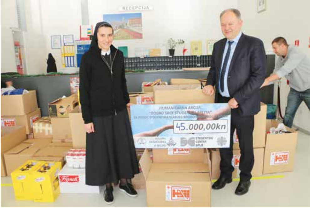
Predaja čeka splitskom Caritasu