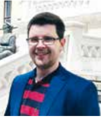
Piše: IVAN PERKOV

Sveučilišna autonomija i njezino očuvanje strateška je politička tema Europe. U razmjerno nerazvijenoj Hrvatskoj ova je tema utoliko važnija, pogotovo u kontekstu izrade novog, konzistentnijeg zakonskog okvira koji bi na jedinstven način trebao regulirati sve dimenzije javne politike visokog obrazovanja, znanosti i tehnologije. Stoga smo u četiri broja Universitas (93-96) ekstenzivno prikazali rezultate istraživanja što ga o sveučilišnoj autonomiji još od 2007. provodi Europska asocijacija sveučilišta (EUA), pri čemu se u dokumentu "Sveučilišna autonomija u Europi III" među promatranim zemljama prvi put pojavila i Hrvatska. Rezultati analize otkrili su mnoge različitosti sustava u kojima se europska sveučilišta razvijaju i transformiraju.