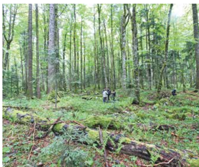
Dio europskog projekta Rewilding je i Velebit

Na predavanju su sudjelovali studenti i profesori Šumarskoga, Agronomskoga i Prirodoslovno-matematičkoga fakulteta Sveučilišta u Zagrebu te predstavnici državnih institucija i nevladinih udruga iz zemlje i iz Europske unije. T. KLARIĆ