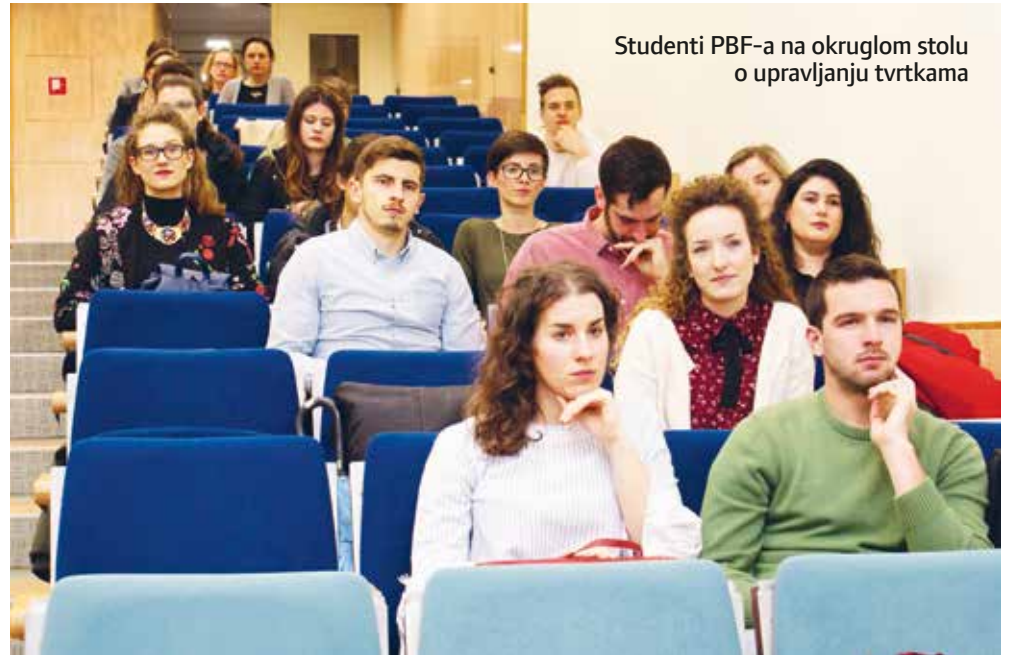
Studenti PBF-a na okruglom stolu o upravljanju tvrtkama

Studenti PBF-a su u okviru izrade seminarskoga rada za potrebe kolegija Menadžment, odabrali najbolje prehrambene tvrtke temeljem analize financijskih pokazatelja poslovanja te pozvali njihove menadžere da prenesu svoja iskustva studentima