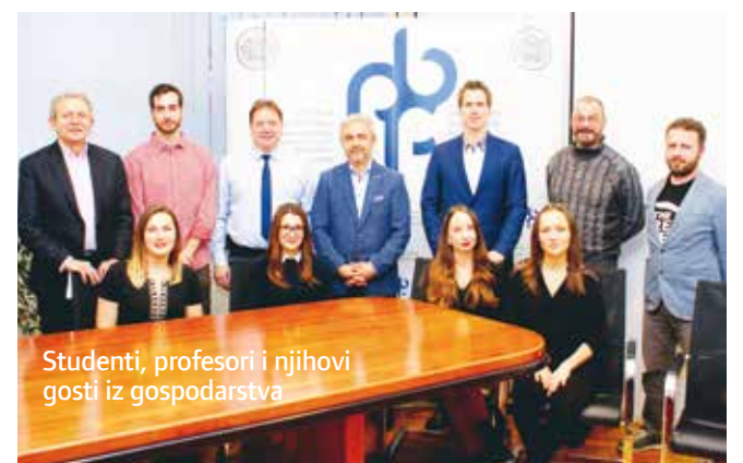
Studenti, profesori i njihovi gosti iz gospodarstva