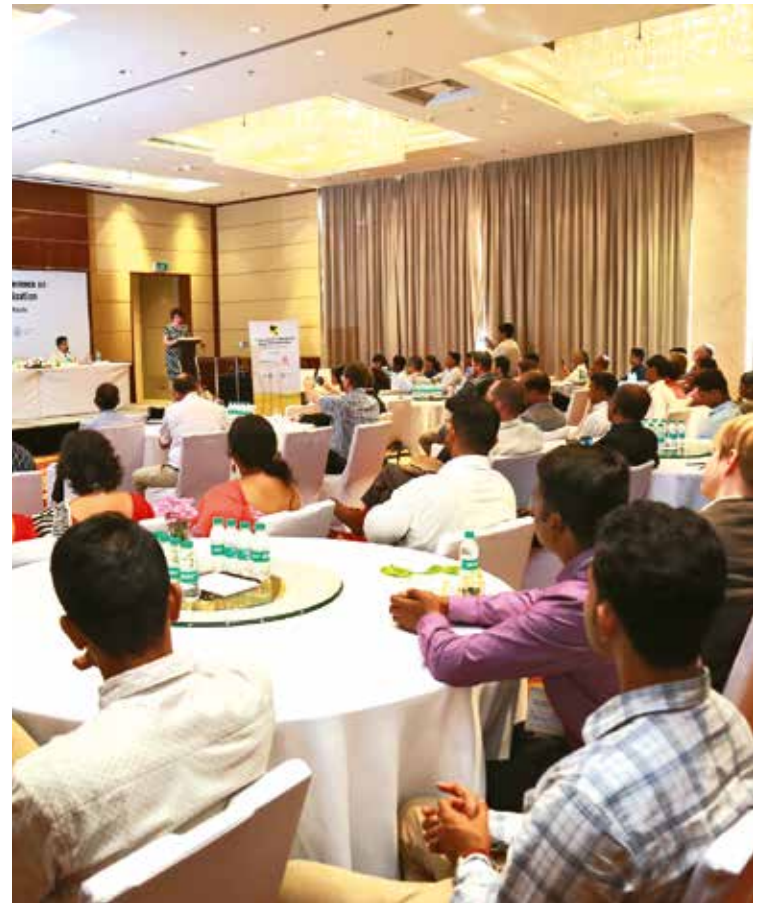
Konferencija o održivoj globalizaciji u Indiji

SVEUČILIŠTE U ZAGREBU MEĐU GLAVNIM ORGANIZATORIMA MEĐUNARODNE ZNANSTVENE KONFERENCIJE U INDIJI