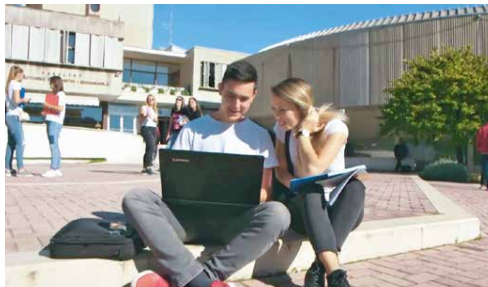
Kadran iz novog promotivnog filma Sveučilišta u Splitu

nik projekta, kazavši kako su se vodili vizijom da maturant može, uz sve informacije koje su i dosad nudene na klasičnoj smotri, "prošetati" iz svog doma klikom miša po predavaonicama, laboratorijima, menzama i osjetiti kako je to biti student Sveučilišta u Splitu.