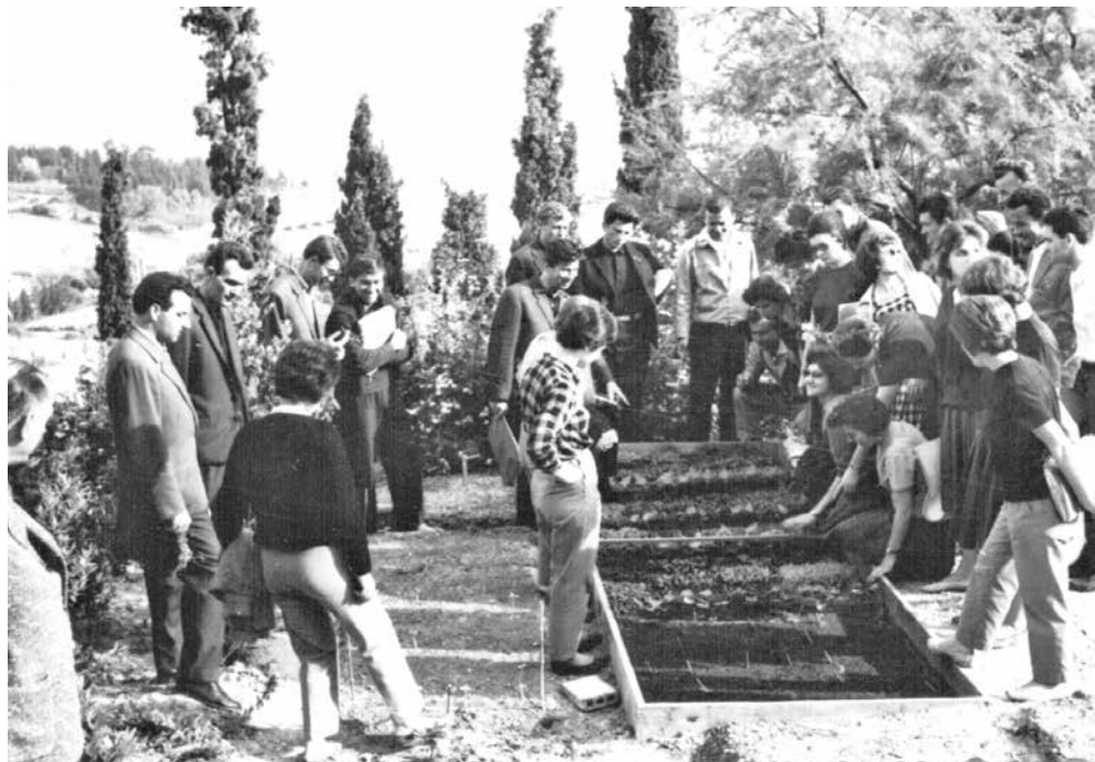
Botanički vrt na Marjanu u svojim zlatnim danima