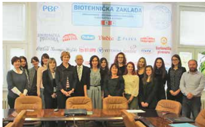
Dobitnici stipendija i potpora Biotehničke zaklade