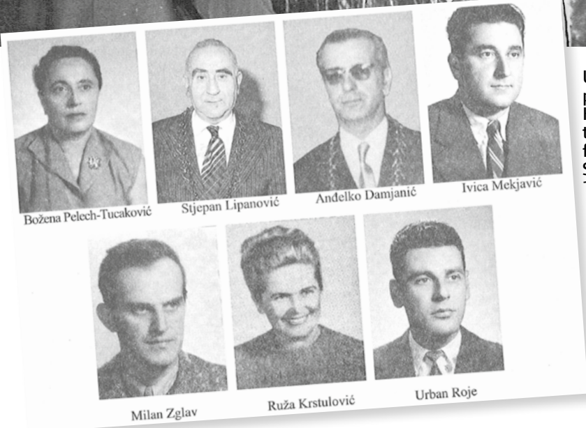
Utemeljitelji prvih zavoda Kemijsko-tehnološkog fakulteta u Splitu (1960-1963)

organiziranje i razvijanje znanstvenoistraživačkog rada unutar zavoda. U radu su, uz mlade suradnike, sudjelovali su i studenti, kroz teme svojih diplomskih radova. Sljedeći univerzalne kriterije sveučilišnoga nastavnog djelovanja, pripremio je i objavio dvije skripte i dva sveučilišna udžbenika-priručnika iz fizikalne kemije. Od utemeljenja fakulteta značajno je doprinio sazrijevanju i afirmaciji nastave u znanstvenom polju kemije u okviru stručnih i sveučilišnih obrazovnih programa. Dugi niz godina predavao je fizikalnu kemiju i za studente Fakulteta prirodoslovno matematičkih znanosti i odgojnih područja Sveučilišta u Splitu, smjer biologija - kemija. Svojim nastavnim radom prožetim smirenošću i ustrajnošću za mnoge generacije studenata visoko je uzdigao značaj fizikalne kemije za opću kemijsku spoznaju. Poticao je kod studenata samostalnost rada i korištenje dostupne literature. Na pismenom dijelu ispita, pri rješavanju numeričkih primjera, studenti su mogli koristiti stručne knjige i priručnike po vlastitom izboru. U svojoj nastavnoj praksi bio je blizak onom sveučilišnom stavu, koji se često pripisuje P. L. Kapici (1894. - 1984.), velikom ruskom fizičaru prošlog stoljeća, prema kojem stručnjak samo zna - što se u kojoj knjizi nalazi. Bio je