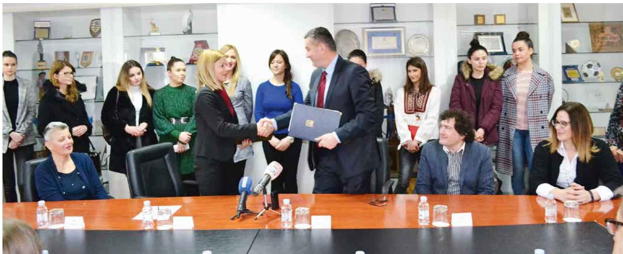
Grad Split poslužit će kao nastavna baza splitskom Pravnom fakultetu