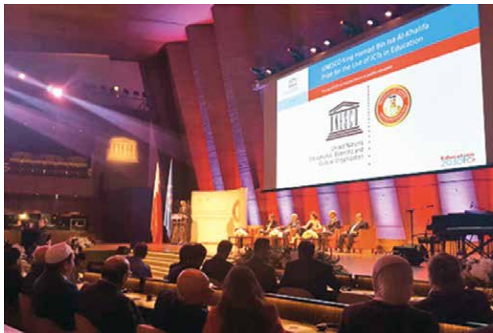
Skup UNESCO-a na kojem je nagrađen CARNET

Povodom nagrade, ministrica znanosti i obrazovanja Blaženka Divjak priopćila je da će MZO i dalje podržavati aktivnosti na informatizaciji obrazovnih ustanova i poticanju uporabe IKT-a u učenju i poučavanju: