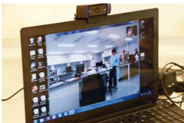
Virtualna suradnja s Pennom