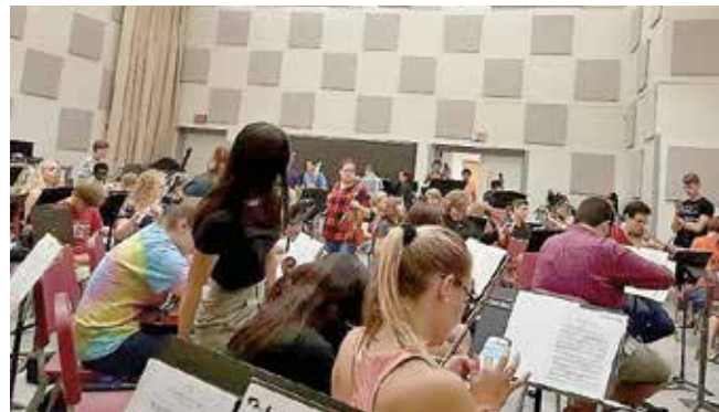
S probe filharmonije Penn Statea

mno ponosni. Već prvog popodneva slijedili su susreti s profesorima zaduženim za nas.