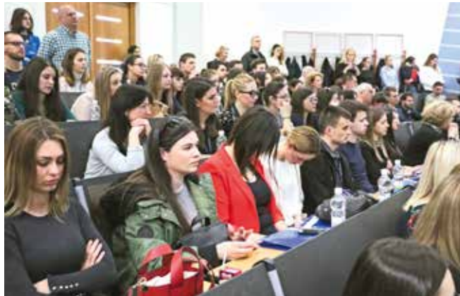
Dobro posjećena rasprava o euro izazovima

Panel diskusiju otvorio je Boris Vujčić prezentirajući eurostrategiju Vlade i Hrvatske narodne banke. Referirajući se na koristi i troškove uvođenja eura Vujčić je kao najznačajnije koristi za građane naveo uklanjanje valutnog rizika i snižavanje kamatnih stopa. Pritom, posebno je istaknuo visoku euroiziranost hrvatskoga gospodarstva kao dodatni motiv za ulazak u eurozonu, ali i povećanje financijske stabilnosti, koja će uslijediti s uvođenjem jedinstvene valute. Jednostavnije rečeno, ulaskom Hrvatske u eurozonu euro će prestati biti neslužbeno i postati službeno sredstvo plaćanja čime će se otkloniti valutni rizik kojemu je trenutno izložena većina gospodarskih subjekata i