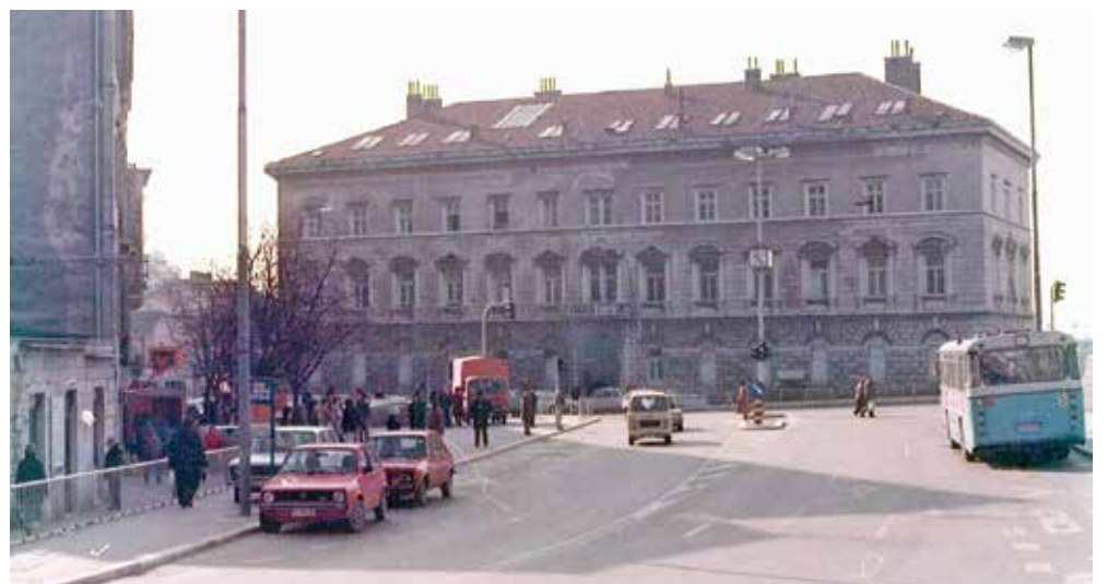
Prvo sjedište fakulteta bilo je u ranijoj i današnjoj nadbiskupskoj palači

ne može pratiti isključivo preko knjiga i časopisa.