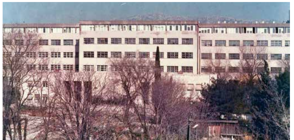
Zgrada u Teslinj ulici, jedna od lokacija splitskog KTF-a

“ Za uspješnost obnašanja dužnosti sveučilišnog profesora važno je balansiranje između nastavnih obaveza i znanstvenog rada