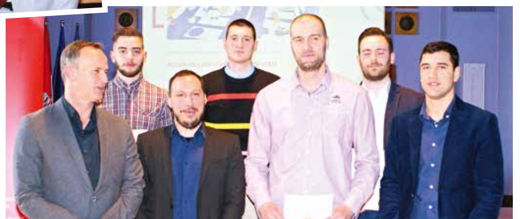
Nagrađena košarkaška momčad Verna