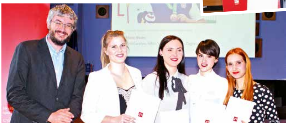
Stolnotenisačice Sveučilišta u Zadru, dobitnice nagrade za fair play