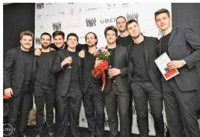
Pobjednici po odluci žirija i po glasovima publike, klapa Pianissimo

U programu je nastupilo osam klapa, od toga pet muških - Gradec, Mašklin, Lugarin, Pianissimo i Arancin, ženske klape Euterpa i Trebatinke te mješovita klapa Falkuša. Prema izboru stručnog žirija sastavljenog