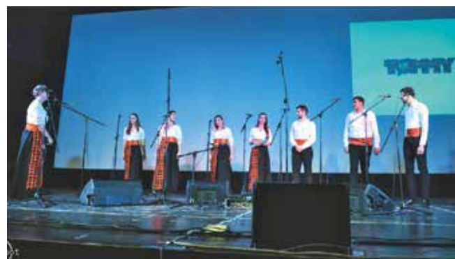
Trećeplasirana je bila mješovita klapa Falkuša

SVEUČILIŠTE U ZAGREBU PRIRODOSLOVNO-MATEMATIČKI FAKULTET Zagreb, Horvatovac 102a Fakultetsko vijeće Prirodoslovno-matematičkog fakulteta na temelju članka 82. i 89. Statuta Fakulteta raspisuje