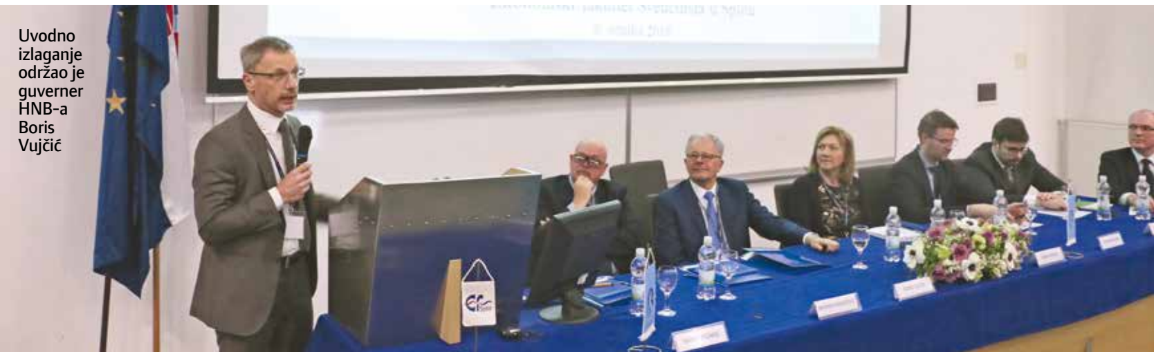
Uvodno izlaganje održao je guverner HNB-a Boris Vujčić