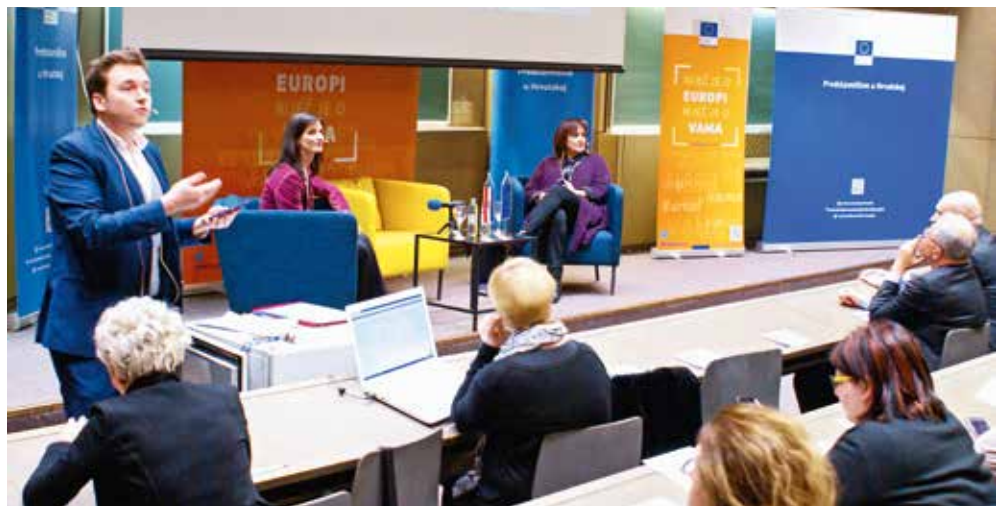
Mariya Gabriel i Dubravka Šuica na FER-u