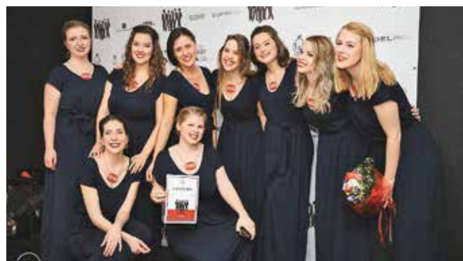
Drugo mjesto pripalo je ženskoj klapi Euterpa