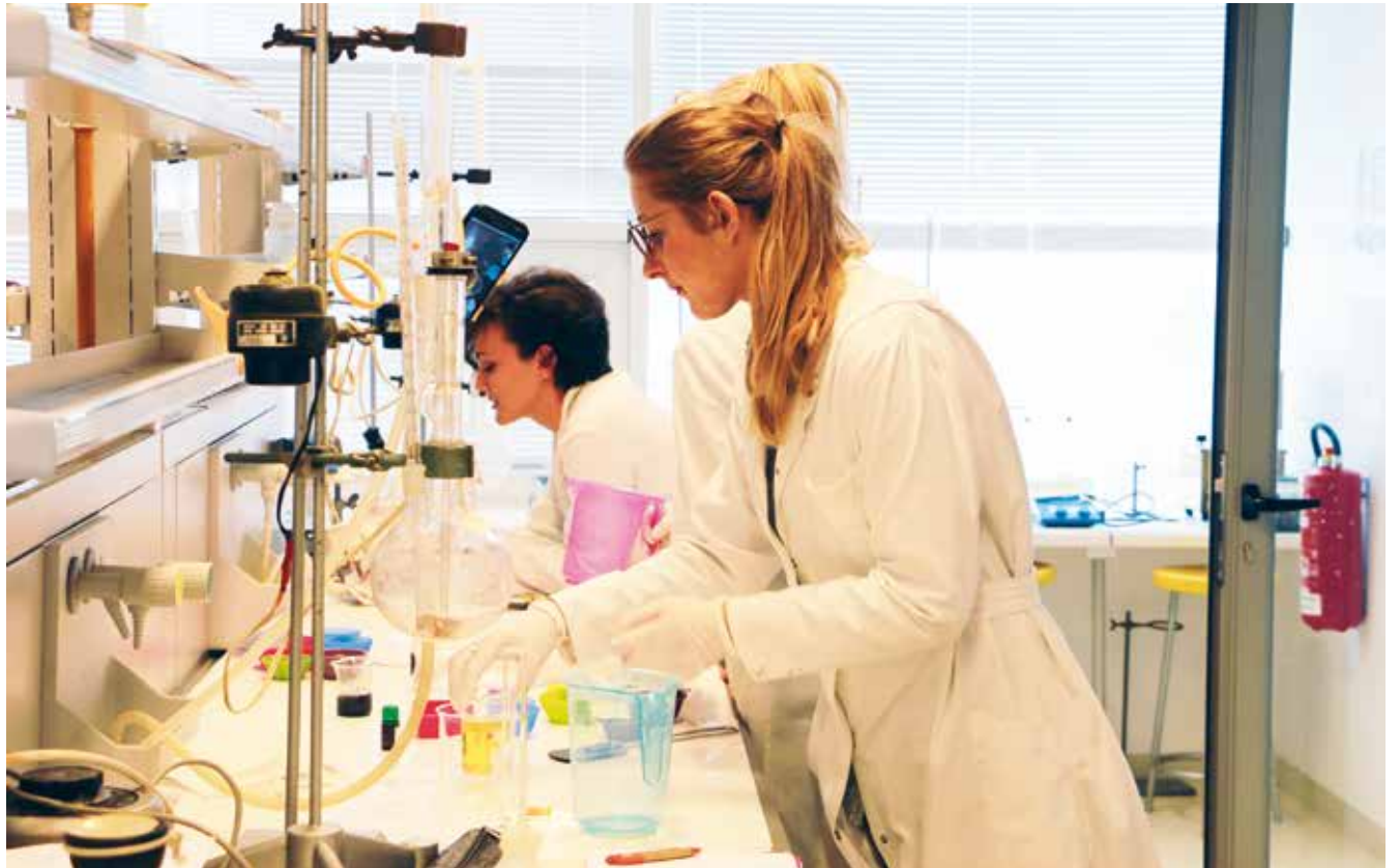
Rad splitskih studentica u laboratoriju KTF-a