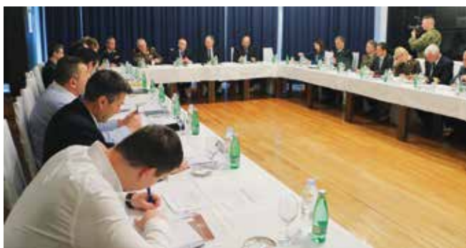
Prva sjednica vijeća studija Vojno pomorstvo

Studijski program Vojno pomorstvo petogodišnji je integrirani preddiplomski i diplomski sveučilišni studij namijenjen obrazovanju budućih časnika Ministarstva obrane i Oružanih snaga RH. Studijski program omogućuje obrazovanje i za potrebe Ministarstva mora, prometa i infrastrukture te Ministarstva unutarnjih poslova. Razvijen je u suradnji Hrvatskog vojnog učilišta "Dr. Franjo Tuđman" sa Sveučilištem u Splitu. Studij traje pet godina ili 10 semestara i njegovim završetkom stječe se 300 ECTS bodova. Nakon druge godine studija studenti će moći izabrati smjer vojne nautike, smjer vojnog brodogojarstva i smjer vojne elektrotehnike. Za akademsku godinu 2019./2020. planira se da će se nastava studija Vojnog pomorstva odvijati i na engleskom jeziku. Završetkom studijskog programa stječe se akademski naziv magistar/magistra, inženjer/inženjerka vojnog pomorstva. Planirana je kvota prvog naraštaja kadeta Vojnog pomorstva njih 40, od kojih 30 kandidata MORH-a, pet MUP-a i Ministarstva mora, prometa i infrastrukture te pet za kandidate iz drugih država koji će upisati studij u akademskoj godini 2018./2019. u Splitu. Podsjećamo, Ministarstvo obrane je 14. ožujka 2018. godine raspisalo javni natječaj za prijam u kadetsku službu 30 kandidata/kinja za upis na prvu godinu integriranog preddiplomskog i diplomskog sveučilišnog studija na Sveučilištu u Splitu. Rok za podnošenje prijave je 27. travnja 2018. godine.