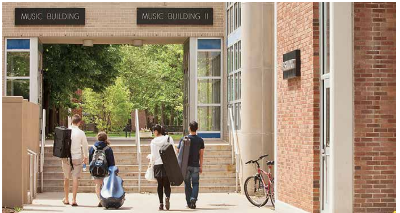
Glazbeni odjel College of Arts and Architecture na Penn Stateu

Sveučilište u Splitu, Sveučilišni odjel za studije mora, Ruđera Boškovića 37, P.P. 190, 21000 SPLIT