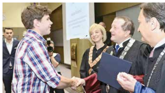
S jedne od ranijih dodjela rektorovih nagrada

Prijava radova obavlja se popunjavanjem odgovarajućih obrazaca na mrežnoj stranici Sveučilišta u Zagrebu https://apps.unizg.hr/reaktorova-nagrada/ . Za Rektorovu nagradu mogu