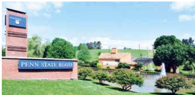
Beaver Campus na Pennsylvania State Universityju

Beaver Campusa se prethodno upoznao putem chata, a nije problem ni stručni engleski jezik.