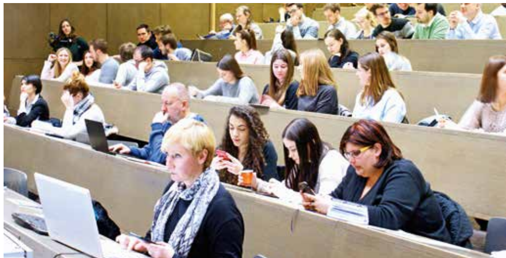
Publika na predavanju na Fakultetu elektrotehnike i računarstva

POVJERENICA EUROPSKE KOMISIJE MARIYA GABRIEL NA FER-U