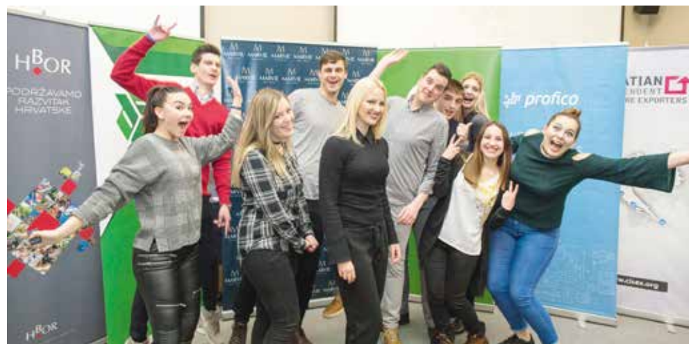
Studenti organizatori konferencije 3P Zeleno poduzetništvo

I ove godine je 3PSplit konferencija pokazala ono što joj je cilj bio u svih šest godina: da je poduzetništvo u Hrvatskoj moguće, unatoč brojnim preprekama, kako regulatornim tako i administrativnim, koje koč poslovanje i ne idu uvijek na ruku poduzetnicima