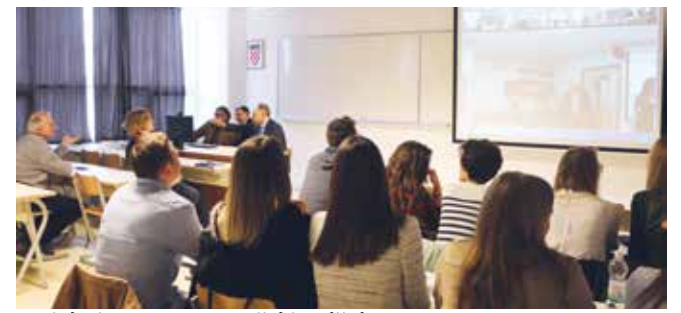
Projekt je započeo teorijskim dijelom