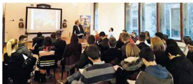
Predavanje u sklopu Salonae Longae u Muzeju grada Splita

U Splitu je i ove godine, deveti put, održan seminar za školsku mladež Salonae Longae - Od antičke Salone do humanističkog Splita na kojem su sudjelovali učenici Privatne klasične gimnazije i Klasične gimnazije iz Zagreba, Prve gimnazije iz Maribora, Franjevačke klasične gimnazije iz Visokog u BiH, te učenici Prve gimnazije iz Splita. Organizatori seminara bili su splitska Prva gimnazija, Institut za povijest umjetnosti - Centar Cvito Fisković, Institut Latina & Graeca iz Zagreba, Katedra za staru povijest Odsjeka za povijest Filozofskog fakulteta Sveučilišta u