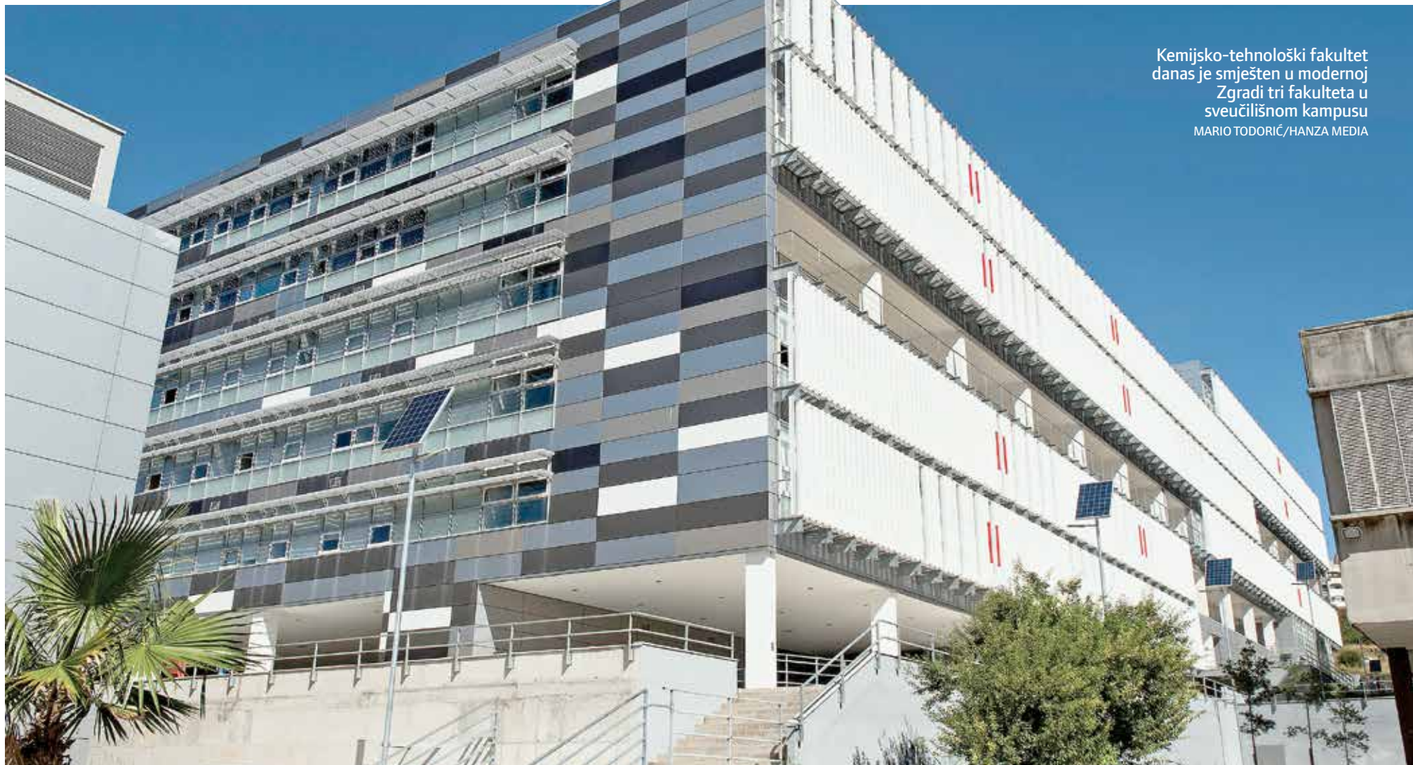
Kemijsko-tehnološki fakultet danas je smješten u modernoj Zgradi tri fakulteta u sveučilišnom kampusu

RETROVIZOR: SJEĆANJE NA JEDNOG OD UTEMELJITELJA KEMIJSKO-TEHNOLOŠKOG FAKULTETA U SPLITU