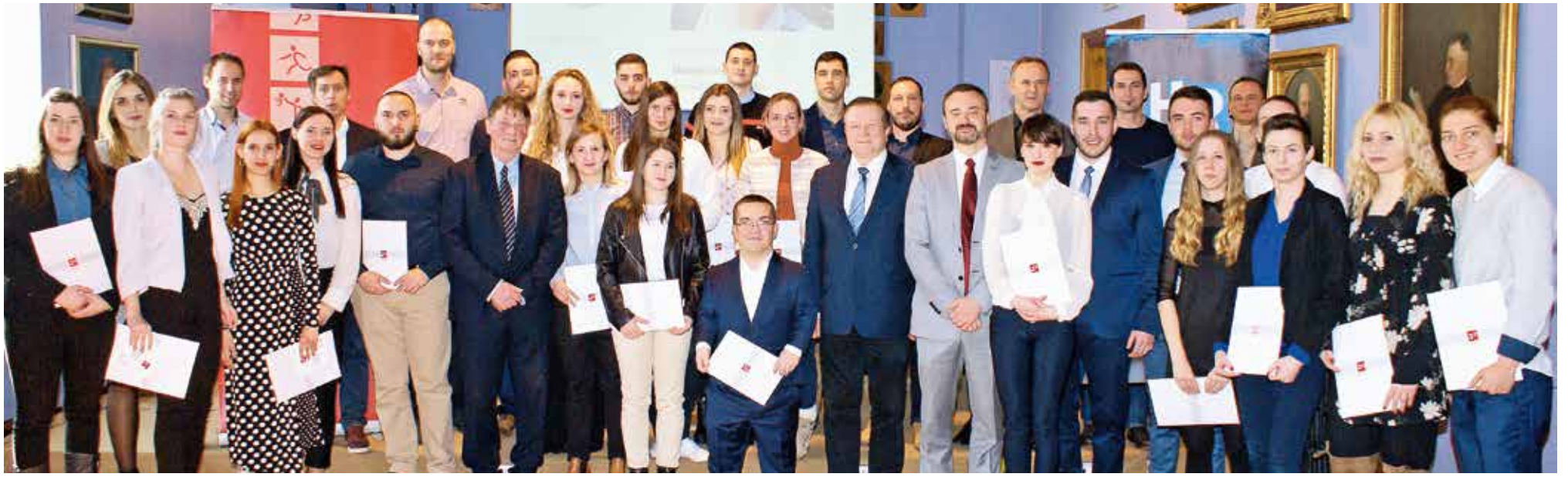
Dobitnici nagrada Hrvatskog akademskog sportskog saveza

DODIJELJENE NAGRADE HRVATSKOG AKADEMSKOG SPORTSKOG SAVEZA